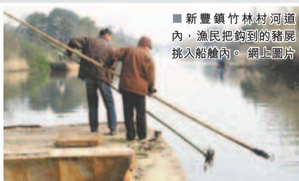
新豐鎮竹林村河道內，漁民把釣到的豬屍挑入船艙內。

香港文匯報訊 據中國青年網報道，上世紀90年代，浙江省嘉興市新豐鎮的漁民要比農民富裕，鎮上最高的樓房也是漁民所蓋。而近年來，因為新豐鎮的河裡只有撈豬屍沒有魚，捕魚這個古老職業即將消亡，撈豬屍這一「新興職業」卻是風生水起。據漁民稱，撈豬屍有時可以日賺150元。