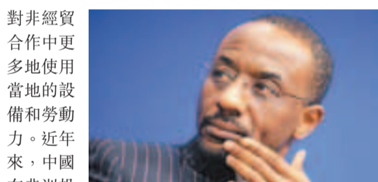
對非經貿合作中更多地使用當地的設備和勞動力。近年來，中國在非洲投資持續增加，給非洲國家帶來經濟增長、稅收貢獻、創造大量的就業機會，培訓了大量的人才。

商務部數據顯示，2012年底，中國對非直接投資的存量已經接近200億美元，超過2,000家中國企業在非洲投資建廠，合作領域從傳統的農業、採礦業、建築業逐步向礦產品深加工、製造業、金融、商貿、地產、旅遊等拓展。