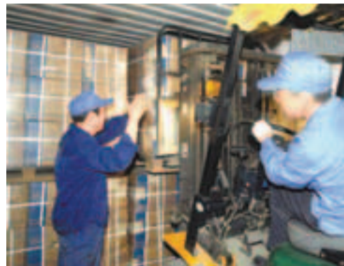
華北製藥集團及其旗下的維爾康製藥有限公司遭美法院開出10億元的罰單。圖為其生產車間一隅。 資料圖片