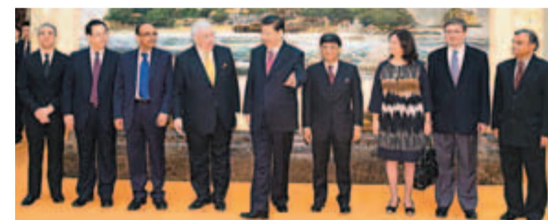
國家主席習近平昨日在北京人民大會堂與前來採訪的金磚國家媒體負責人合影。

香港文匯報訊(記者 葛沖 北京報導)國家主席習近平即將訪問俄羅斯、坦桑尼亞、南非、剛果共和國並出席金磚國家峰會。關於金磚國家合作，習近平昨日向媒體指出，全球經濟治理體系必須反映世界經濟格局的深刻變化，增加新興市場國家和發展中國家的代表性和發言