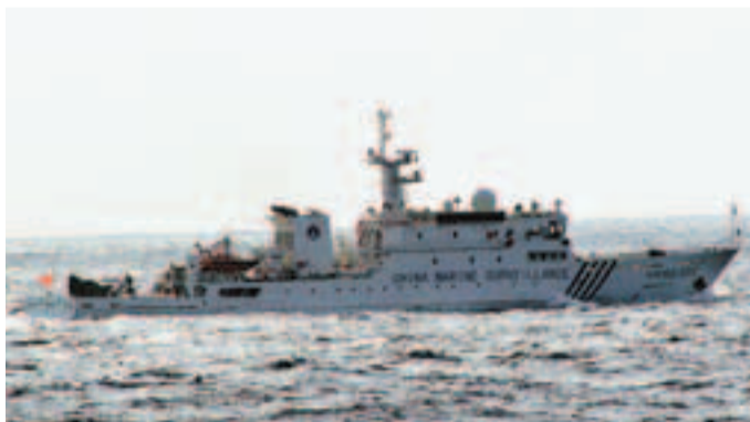
■中國海監137、15、8002船編隊昨日在中國釣魚島領海內巡航。圖為海監「8002船」。

香港文匯報訊 據國家海洋局網站消息，中國海監137、15、8002船編隊昨日在中國釣魚島領海內巡航期間，向日方嚴正聲明釣魚島及其附屬島嶼自古以來就是中國的固有領土，要求日方船舶立即離開中國領海。這是中國海監船連續3日巡邏連接釣魚島附近海域。