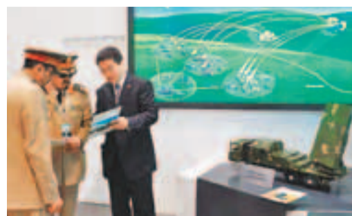
■今年2月19日，阿布扎比國際防務展，一家中國軍工企業正向參觀者展示該企業推出的相控陣戰場炮位偵察定位雷達。

對此，洪磊表示，中國的軍品出口遵循三項原則：一是有助於接受國的正當自衛能力；二是不損害有關地區和世界的和平、安全與穩定；三是不干涉接受國內政。