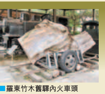
羅東竹木舊驛內火車頭