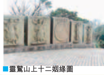
靈鷲山上十二姻緣圖

宜蘭礁溪的林美山上有兩所大學，一所是淡江大學宜蘭分部，另一所就是佛光大學，佛光大學是由星雲法師所創辦的大學，校訓為星雲大師所提示的「義正道慈」，以人文社會科學為教育核心的大學。不要誤會佛光大學只是讀佛學的，他們有佛教研習學院外，還有人文學院、社會科學暨管理學院、理工學院，文學系還設有博士班。佛大最注重歷史傳承，在現代大學的架構上，仍能體現宋明書院的傳統。特別喜歡集合一些在著名大學退休的，但仍精力充沛，經驗豐富的教授來佛大繼續傳授知識、培育儒雅君子的使命，又與內地多間大學展開交流生計劃。