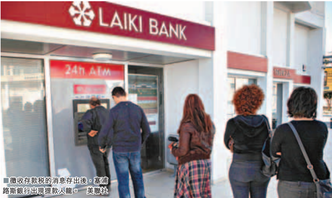
徵收存款稅的消息傳出後，塞浦路斯銀行出現取款人龍。

200億歐元(約2,030億港元)。據估計，近半數的塞浦路斯存款戶口由非當地居民的俄羅斯富豪持有，這些戶口被德國指控是洗黑錢的渠道。歐洲央行理事阿斯穆森則指，要減少援助規模，有必要從銀行體系取得資金。外界估計塞國銀行業資產相當於國內生產總值(GDP)的5倍。