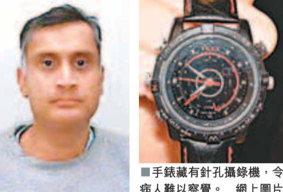
手錶藏有針孔攝錄機，令病人難以察覺。

據報貝恩斯使用的手錶為Ticex 4GB高清攝錄防水手錶，在錶面數字6的地方藏有高清像針孔攝錄機，使用簡單的開關裝置便可錄影，網上售價約60英鎊(約704港元)。 ■《每日郵報》