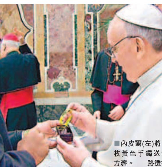
內皮爾(左)將一枚黃色手鐲送給方濟。

常語出驚人 「不做愛防愛滋」 72歲的內皮爾語出驚人早有前科，他曾指放棄做愛比使用避孕方法，更有效阻止愛滋病傳播。 ■《每日郵報》/英國廣播公司