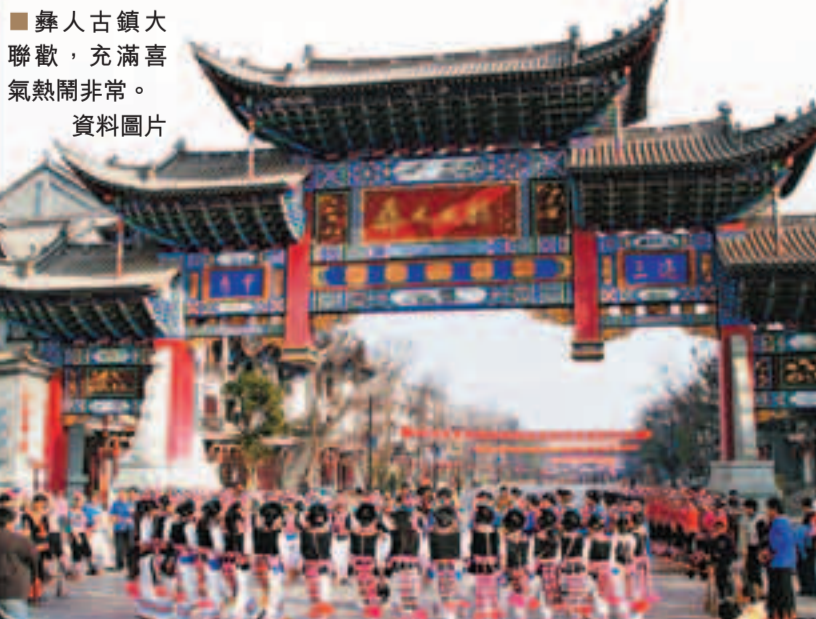
彝人古鎮大聯歡，充滿喜氣熱鬧非常。資料圖片

攝影師說：沒有皇家園林的氣勢和華麗，沒有金字塔的神秘和奪目，沒有皇宮的艷麗和璀璨，但它粉牆黛瓦的淳樸和幽靜，卻讓我久久陶醉——楚雄彝人古鎮。