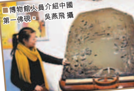
博物館人員介紹中國第一佛硯。