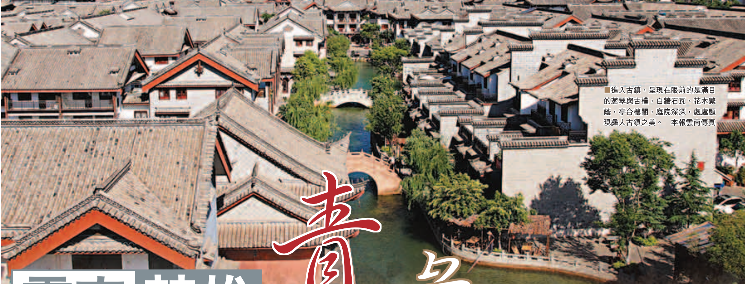
進入古鎮，呈現眼前的是滿目的蔥翠與古樸，白牆石瓦、花木繁蔭，亭台樓閣，庭院深深，處處顯現彝人古鎮之美。