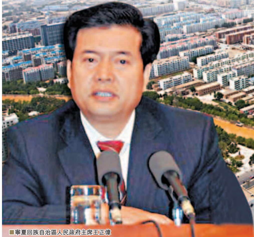
■寧夏回族自治州人民政府主席王正偉