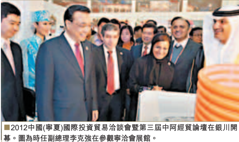
■2012中國(寧夏)國際投資貿易洽談會暨第三屆中阿經貿論壇在銀川開幕。圖為時任副總理李克強在參觀寧洽會展館。