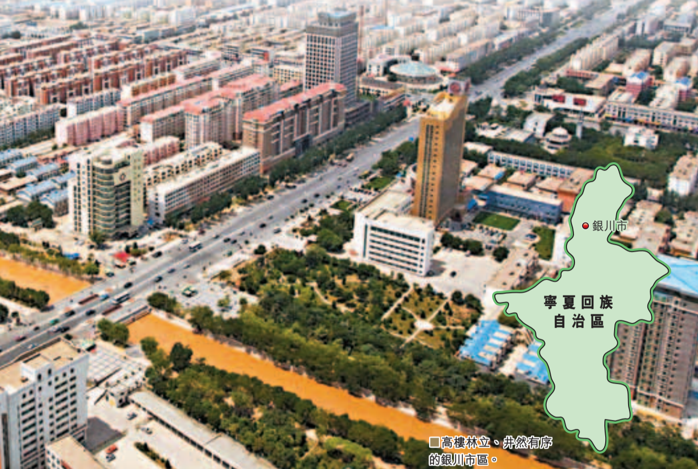
■高樓林立、井然有序的銀川市區。