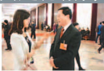
■ 新疆生產建設兵團政委車俊接受本報訪問。

他並指出，當前兵團也面臨着走城鎮化、工業化、農業現代化的道路，要「走出去」，也要打開大門，讓世人更多的了解兵團，讓各類投資者更多的參與兵團的建設和發展，「所以我們5月份也將要去香港舉行招商活動，對外推介兵團，宣傳