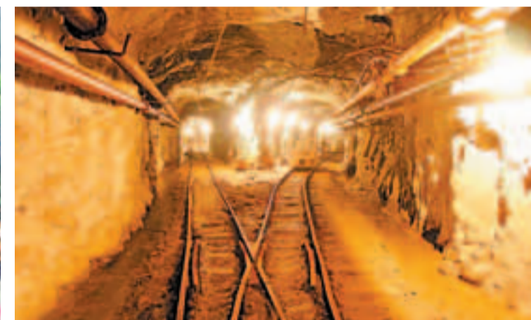
■江南第一礦——遂昌金礦