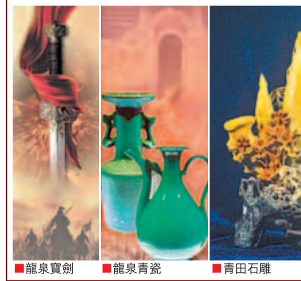
■龍泉寶劍 ■龍泉青瓷 ■青田石雕

青田石雕是中國著名的傳統手工藝品，集鍊、刻、塑技藝於一爐，其歷史悠久，名師倍出，聞名世界，是中國工藝美術領域的一朵奇葩，具有極高的藝術價值和收藏價值，多次選為國禮。青田因材施藝，因色取俏，造型新穎，層次豐富，形象逼真，精美絕倫，成為石雕藝術的一大特色。2006年，青田石雕製作工藝被列入中國第一批非物質文化遺產保護名錄。