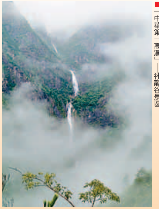
■中華第一高樹——神龍巖巨樹

「閒心對綠水，清靜無兩塵」，而今這個山區的經濟形態正全面向休閒養生經濟轉型。而麗水養老的「國際休閒養生城市」美譽，讓麗水的養生旅遊向前邁了一大步。