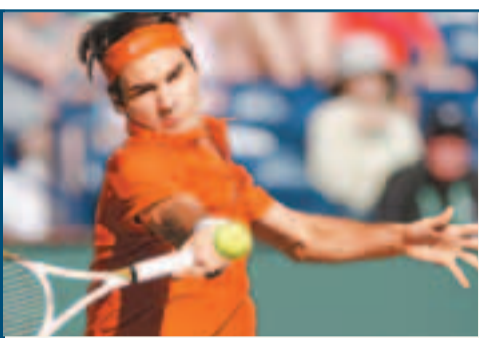
費達拿勝出個人第890場勝仗。

以衛冕身份出戰印第安韋爾斯賽的「費天王」，周一迎來職業生涯的第890場勝利。在男單第3圈賽事中，費達拿以6:3、6:1的總盤數輕鬆淘汰沃克羅地亞球手杜迪，躋身第4圈。