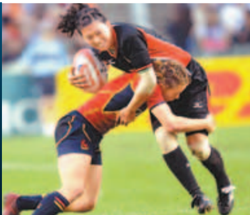
中國隊(上)將與其餘11支球隊角逐廣州站賽事。

香港文匯報訊(記者 敖敏輝、通訊員 陳建族廣州報導)2013世界女子七人欖球賽將於本月30日至31日在廣州舉行，屆時12支頂尖隊伍將參與角逐。這次比賽是世界女子七人欖球系列賽首次登陸中國，也是首次在亞洲舉行該級別的欖球比賽。