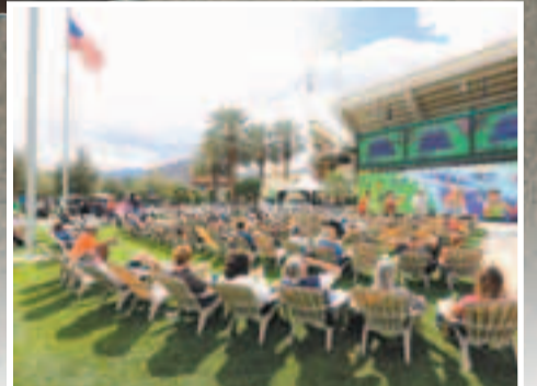
現場大批球迷均表示感到震動。資料圖片

大難不死，拿度緊接遇上老天爺的大禮，第3圈的阿根廷對手邁亞在上陣前因背傷退賽，使拿度不費吹灰之力殺入第4圈，令剛傷癒的拿度有更多時間休息。不過，拿度在第4圈將迎來勢頭兇猛的拉脫維亞球手古比斯。古比斯在今季的表現實在不容小覷，他日前以總盤數2:1逆轉淘汰20號種子、意大利球手塞皮，包括上周以資格賽選手身份贏得德爾雷海灘賽冠軍在內，該名拉脫維亞球手已豪取13連勝紀錄。