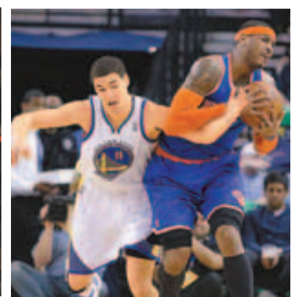
安東尼(右)缺陣3場後復出。