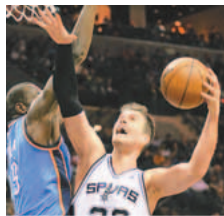
史比列達(右)無懼伊巴卡封阻，強行上籃。