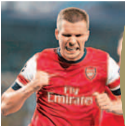
普多斯基上陣成疑。

另一方面，普多斯基今季入了12球和有10次助攻，配得上去夏阿仙奴為他支付的約1.4億港元轉會費。這位德國前鋒有傷在身，是役難望返德倒戈。據英國《太陽報》最新傳出，意甲祖雲達斯擬出約1.7億港元將他羅致麾下。阿仙奴近年連年有球星離隊，雲加還正忙於填補人手。據傳，雲加看上的在曼長時間養傷的後衛米卡李察士以及在皇家馬德里鬱鬱不得志的阿根廷前鋒希古恩，亦對聖伊天門將魯菲亞和前鋒奧巴美揚以及佩斯卡拉門將佩連有興趣。另《每日快報》透露，表明不留巴塞羅那的西班牙門將域陀華迪斯有可能加盟兵工廠，踢過巴塞的槍手傳奇亨利將從中牽線。