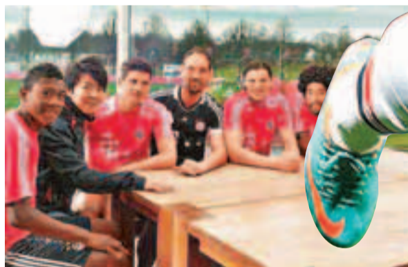
郎朗(左二)與拜仁球員合照。