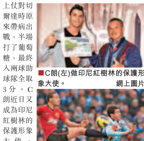
C朗(左)做印尼紅樹林的保護形象大使。

對於曼聯回購C朗，朗拿度及放走朗尼的傳言，紅魔名宿卜比查爾頓不擔心領隊費格遜會願意放走一直為球隊帶來入球的朗尼。卜比查爾頓亦表示，當然希望C朗回巢，「他製造了很多現象級入球，」卻不認為皇馬會放人。皇馬總監布達堅奴就叫其他球會不要打C朗主意，有西班牙傳媒指，這位葡萄牙鋒將