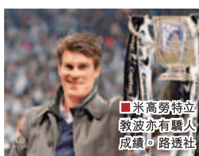
米高勞特立 教波亦有驕人成績。

不過，跌落英超聯倒數第2位的雷丁，解僱了2009年接棒後上季率隊殺返英超的領隊麥達莫，盛傳上月辭去