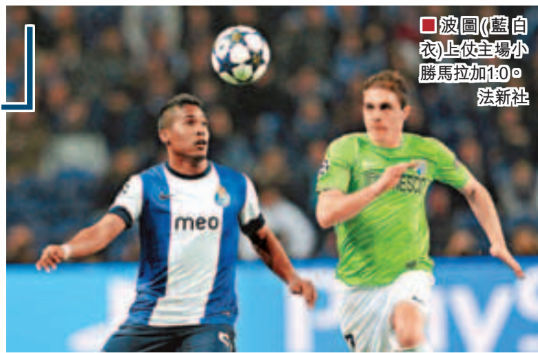
波圖(藍白衣)上仗主場小勝馬拉加1:0。