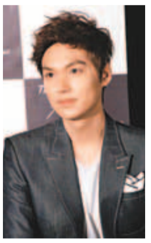
■文：Mana / 圖：中央社

韓國型男李敏鎬(見圖)日前已飛抵美國洛杉磯，出席影迷見面會，吸引不少影迷支持，並用韓文高呼「我愛你」，他亦以飛吻回應。見面會前，他先跟傳媒會面，透露早前赴台灣工作，遺憾逗留時間太短，但看到海灘和橫街小巷，認識到台灣不同的一面，亦很喜歡當地小吃，可惜不能帶回家，而今次到訪美國，則最喜歡吃牛排。