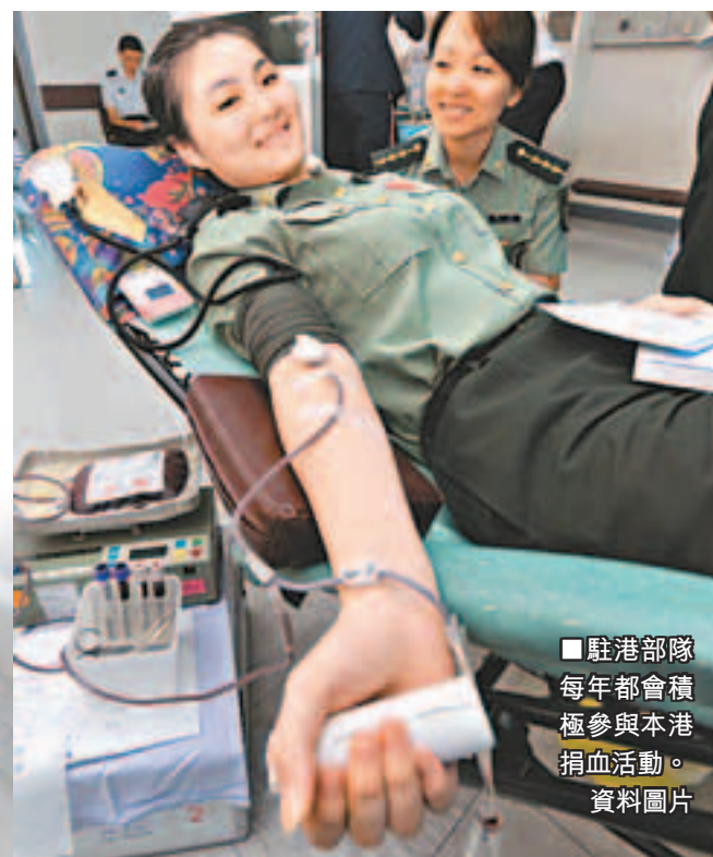
駐港部隊每年都會積極參與本港捐血活動。資料圖片