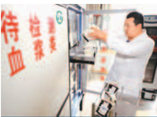
捐出的血液會被儲存起來待檢。資料圖片