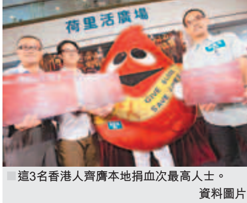
這3名香港人齊齊本地捐血次數最高人士。

更重要是，應對科學捐血的認知進行廣泛宣傳，透過定期的公民教育及宣傳活動，以提高民眾對血液的