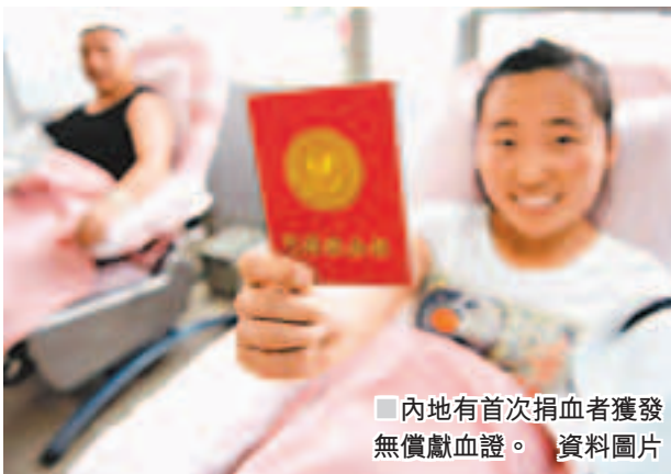
內地有首次捐血者獲發無償獻血證。資料圖片