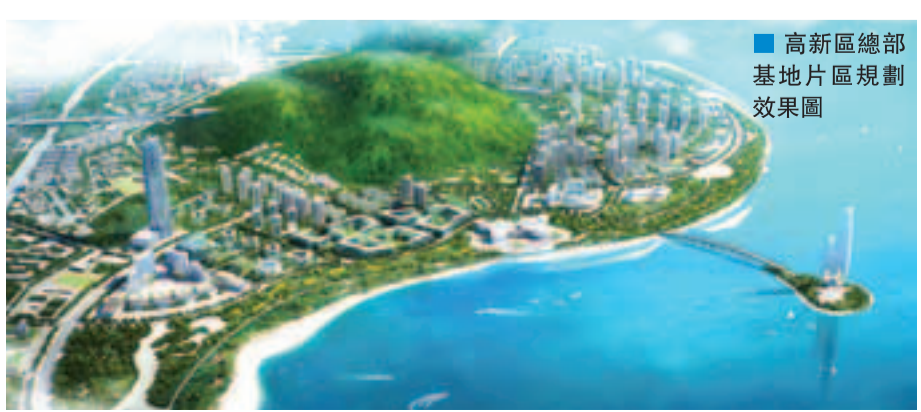
高新區總部基地片區規劃效果圖