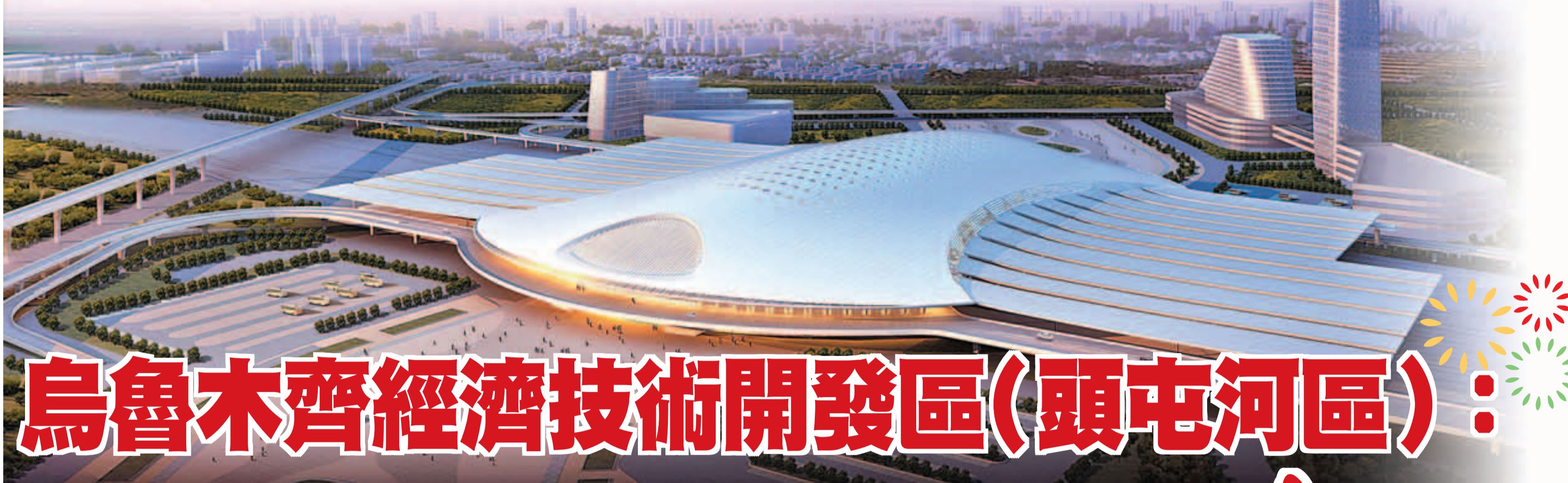
■高鐵新區規劃效果圖