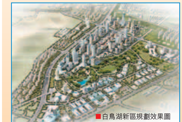
■白鳥湖新區規劃效果圖