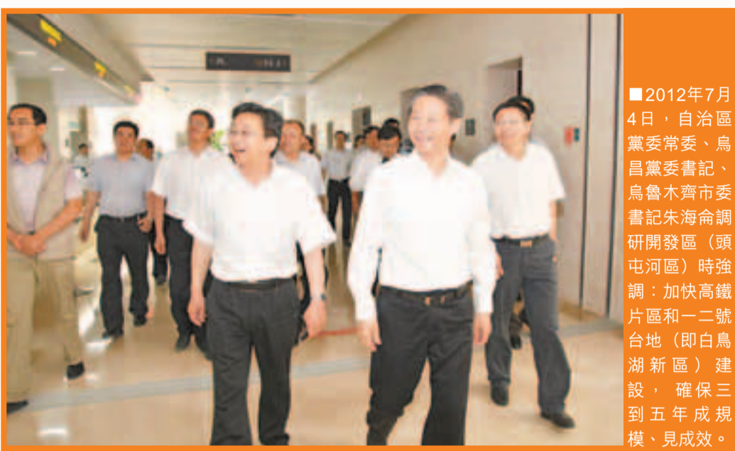
■2012年7月4日，自治區黨委常委、烏魯木齊市委書記朱海倫調研開發區（頭屯河區）時強調：加快高鐵路片區和二宮台地（即白鳥湖新區）建設，確保三到五年成規模、見成效。

一個戰略，一座新城，開發區（頭屯河區）承載着跨越式發展的歷史使命，沿着新的定位和責任大步向前。