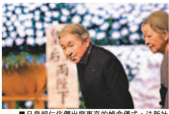
■日皇明仁伉儷出席東京的悼念儀式。