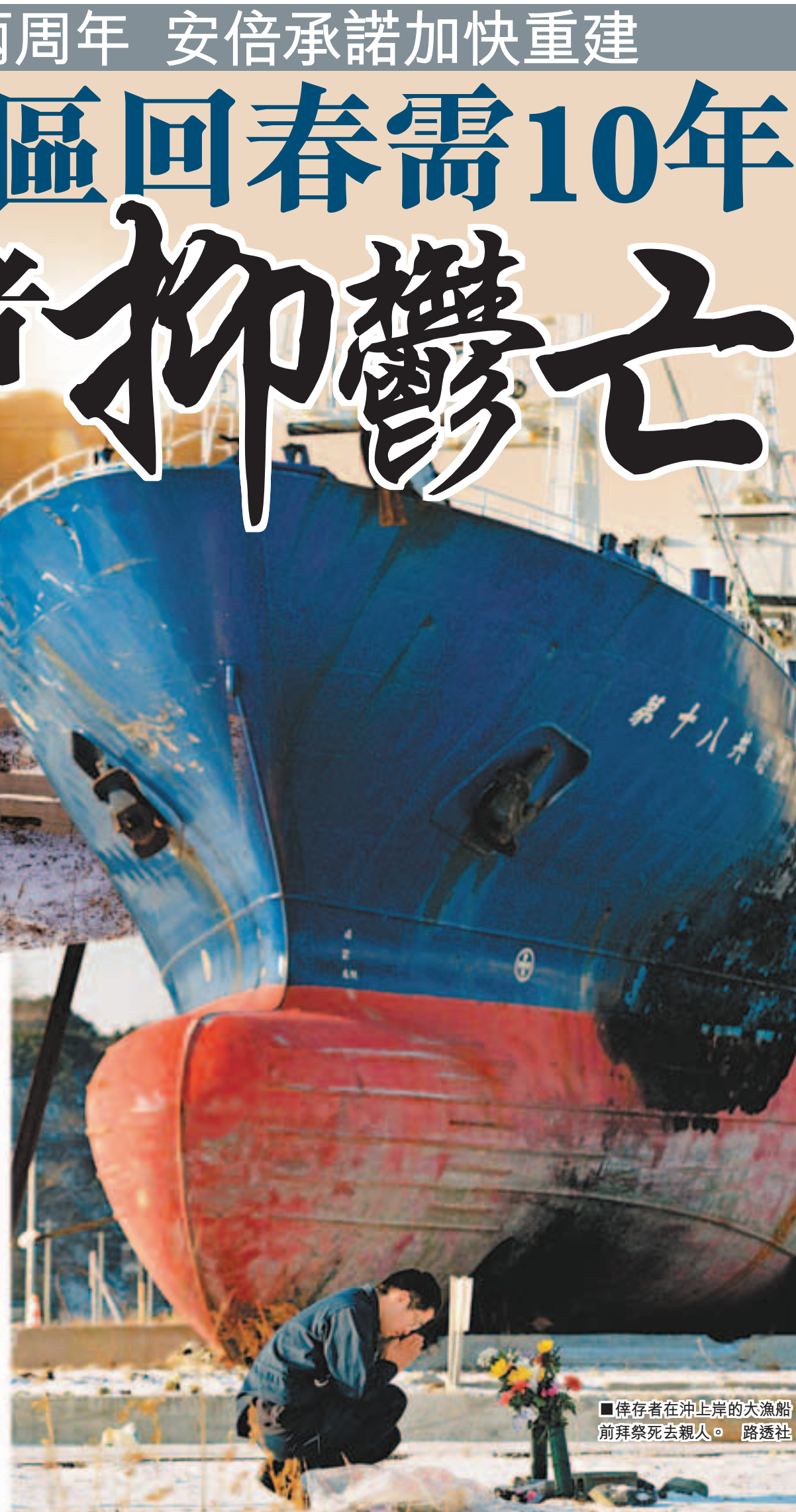
■倖存者在沖上岸的大漁船前拜祭死去親人。

韓媒：日民族主義推倒「零核電」 安倍晉三去年上台後，推前首相野田佳彥提出的「零核電」計劃，宣布重啟核電站。韓國《朝鮮日報》指出，在法國、德國等地以「借鑑福島」為由爆發反核示威之際，日本反核聲音卻逐漸消失，反映在安倍「強大日本」的民族主義口號面前，「零核電」顯然已失去立足之地。 去年日本眾議院大選，很多主張「零核電」的候選人最終落選，反映大部分民眾並不視反核為重要議題。東京首都大學教授山下裕介形容，日本出現了「新的安全神話和民族主義」。 ■韓國《朝鮮日報》