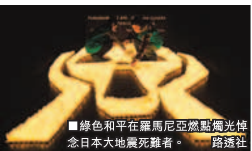
■綠色和平在羅馬尼亞燃點燭光悼念日本大地震死難者。

韓媒：日民族主義推倒「零核電」 安倍晉三去年上台後，推前首相野田佳彥提出的「零核電」計劃，宣布重啟核電站。韓國《朝鮮日報》指出，在法國、德國等地以「借鑑福島」為由爆發反核示威之際，日本反核聲音卻逐漸消失，反映在安倍「強大日本」的民族主義口號面前，「零核電」顯然已失去立足之地。 去年日本眾議院大選，很多主張「零核電」的候選人最終落選，反映大部分民眾並不視反核為重要議題。東京首都大學教授山下裕介形容，日本出現了「新的安全神話和民族主義」。 ■韓國《朝鮮日報》