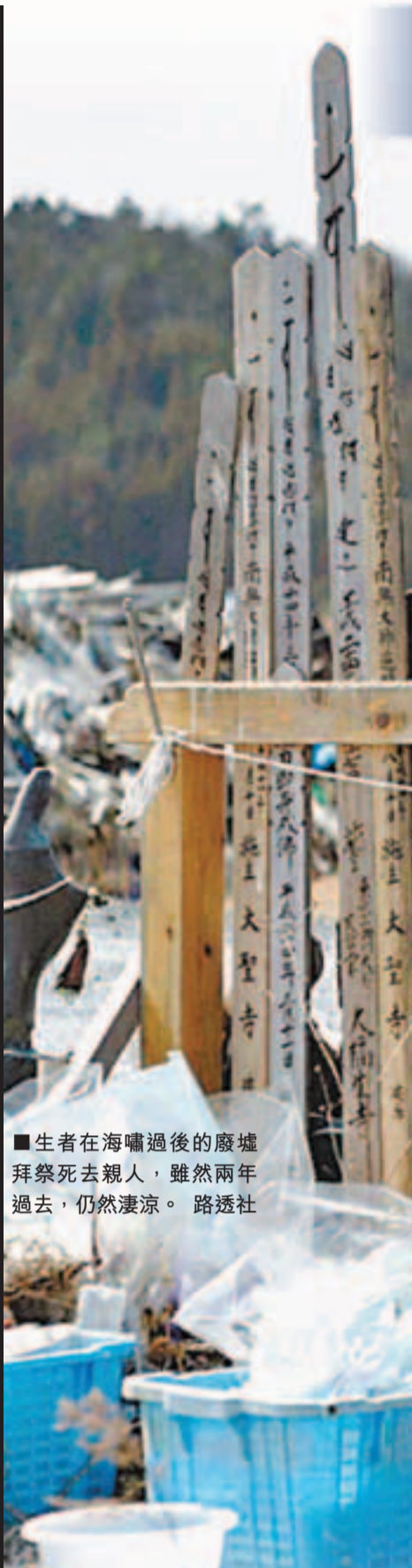
生者在海嘯過後的廢墟拜祭死去親人，雖然兩年過去，仍然淒涼。