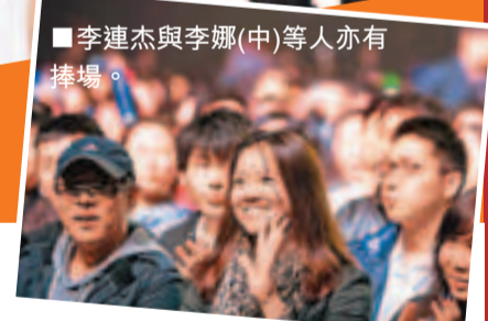
■李連杰與李娜(中)等人亦有捧場。