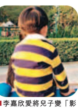
■李嘉欣愛將兒子變「影后」。