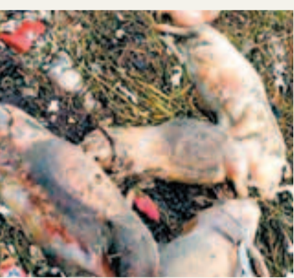
死豬發出陣陣惡臭。網上圖片

據了解,到目前為止,經過有關部門地毯式排摸,查明整個松江區範圍的水域內共發現死豬929頭。