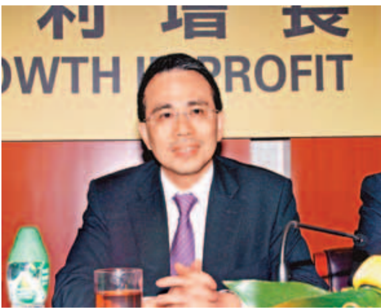
長江基建去年盈利創新高,主席李澤鉅飲得杯落。

年升7%,當中53%的溢利來自海外投資項目。目前公司持有69.8億元現金,負債比率繼續維持於低水平,負債淨額對總資本淨額比率為5%。