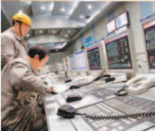
專業技術人員在內地被視為中產。 資料圖片