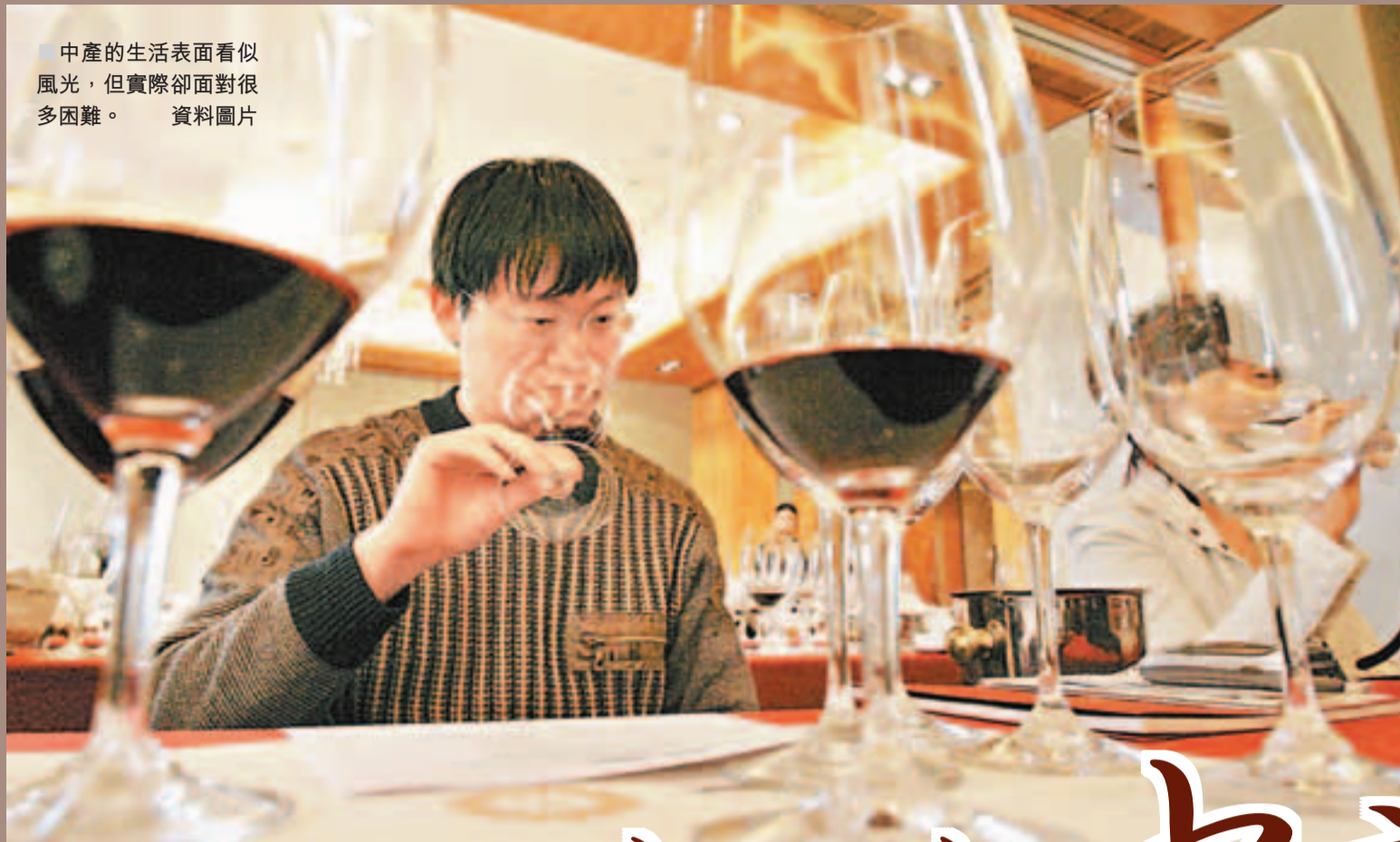
中產的生活表面看似風光，但實際卻面對很多困難。