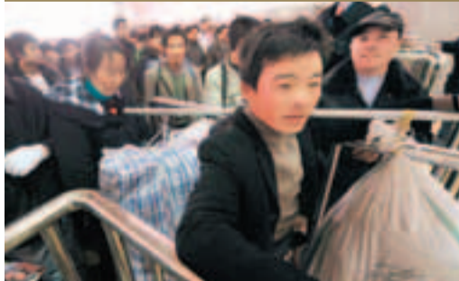
農民工每到春節即擠車回鄉，無奈成了「候鳥」。圖為春運時的杭州火車站。資料圖片

截至2012年末，中國有2.62億進城務工的農民工，其實人們早已形成共識，離開了農民工，很多城市的運轉都要停擺。但這些作出重要貢獻的農民工，卻依然是「候鳥」，每年都要在農村和城市之間大遷徙。