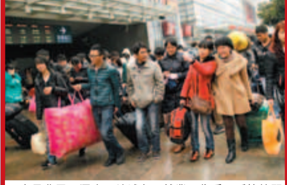
大量農民工湧向一線城市，就業、住房、戶籍等問題相應而生。圖為節後上海的農民工。資料圖片