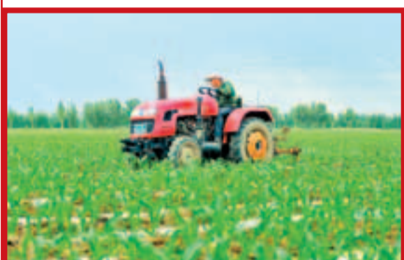
保留農耕面積和綠色發展，同是經濟發展中的主旋律。資料圖片

經濟學家謝國忠是超大城市論的支持者，他最近撰文稱：「人口超過2,000萬的超大城市是未來城市化的發展趨勢」。而飽受詬病的堵車、污染等諸多問題，實際上根源都在於設計或管理，大東京擁有3,000萬人口，但是並不存在任何大城市問題。如果中國合理地選擇鼓勵和投資於大城市的發展，中國就會在未來20年時間裡擁有20座到30座超大城市。這將能夠推動中國經濟走上全球經濟的巔峰。