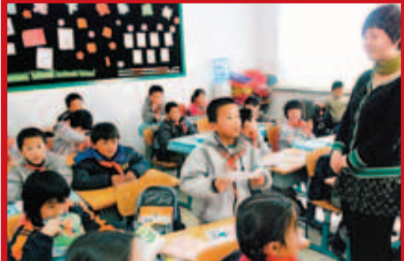
逾兩億農民工進城務工，其子女教育一直是個有待解決的問題。圖為瀋陽農民工子弟小學。