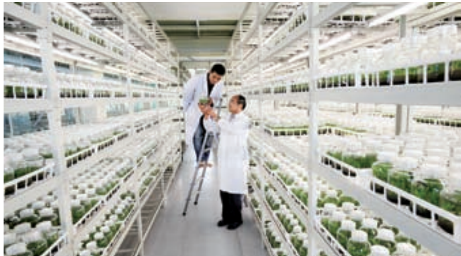
鐵皮石斛組培培養間

自進入西雙版納創建公司以來,光明雲南石斛公司首要任務就是建立高品質的種植基地。兩年來,公司投入大筆資金和科研人員,採取「公司+基地+農戶+科技」的運作模式,用情、用心幫扶農戶,用科技、用現代化的管理打造基地。在基地建設方面,公司採取傳授科技知識、鼓勵農戶種植與租用農戶土地、聘用農戶參加管理兩種方式加大基地的規範化建設。由於公司管理到位、科技含量高,創造了石斛種苗成活率高、發芽率高、效益高的「三高」紀錄,從而推動了高品質石斛的大面積種植,為光明雲南石斛公司打造中國石斛第一品牌奠定堅實基礎。