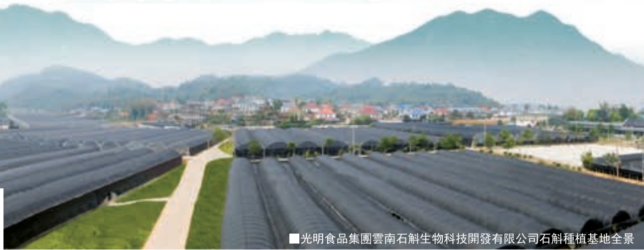
光明食品集團雲南石斛生物科技開發有限公司石斛種植基地全景

鐵皮石斛 是76種石斛族群中的極品,號稱九大仙草之首,古方採鐵皮石斛滋陰強身,益壽延年。由於其不可替代性和稀缺性,被喻為藥中黃金。光明雲南石斛力承鐵皮石斛精髓,繼往開來。