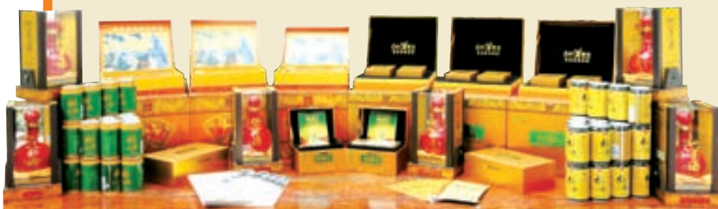
公司自主研發的「九斛堂」鐵皮石斛系列產品。

現代醫學研究鐵皮石斛十大功效:滋陰生津、增強免疫、健脾開胃、護肝利膽、清熱明目、降低血糖、抑制腫瘤、緩解疲勞、滋養肌膚、延年益壽。