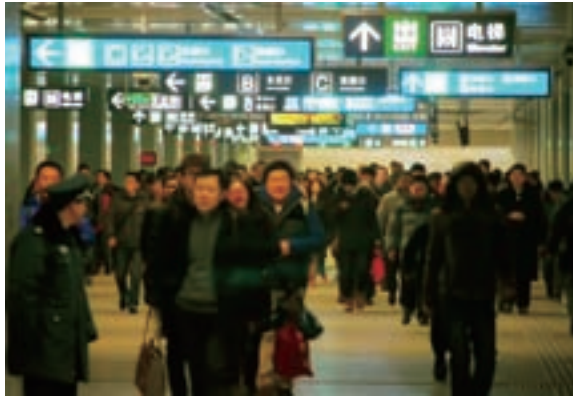
■ 車水馬龍的北京地鐵

住房始終是困擾北京發展的一大難題，為解決低收入者的住房問題，北京市連續多年，下大力氣投資建設保障房。今年，民生保障類項目計劃投資550億元，同比增長39.2%，項目涉及保障性安居工程、山區人口遷移、老舊小區改造等。