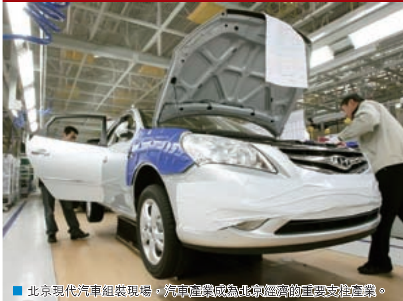
■ 北京現代汽車組裝現場，汽車產業成為北京經濟的重要支撐產業。

近年，從煤礦關停、首鋼停產，到高調治理PM2.5，大規模平原造林，北京走綠色發展之路，累計關關446家高污染、高耗能、高耗水企業，告別了近千年的小煤窖採礦史，單位地區生產總值能耗、水耗分別累計下降25%以上和32%，產業結構向低消耗、低物耗、高產出的輕型化方向發展。