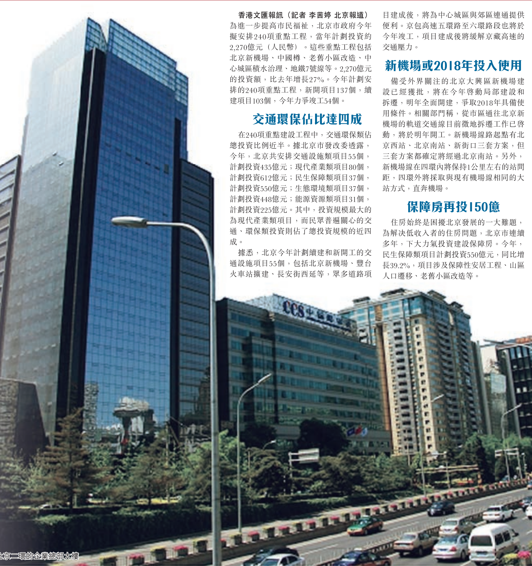
■ 矗立在北京三環路金華門外的大樓

北京市統計局認為，創新驅動作用不夠，與企業尚未發揮創新主體作用有關，應倒逼企業創新轉型，政府營造好的創新環境，加強知識產權保護力度，搭建好產學研對接、企業創新示範、技術成果轉化應用三個平台，讓企業用於創新，樂於創新。