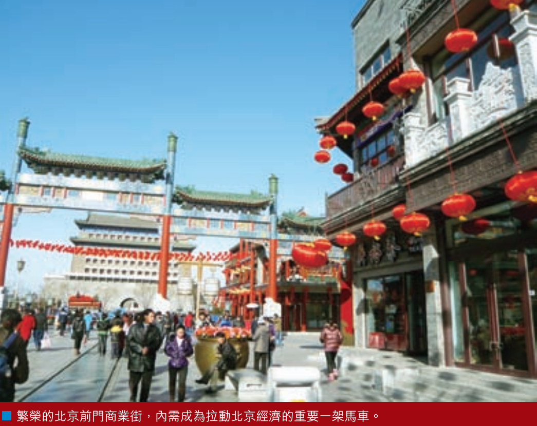
■ 繁榮的北京前門商業街，內需成為拉動北京經濟的重要一駕馬車。

去年至今，北京經濟逐步形成溫和回升態勢，但北京市統計局預計，回升主要是依靠「穩增長」政策帶動，回升基礎有待鞏固，內生動力仍顯不足，消費啓而難動的局而未能破解，雙輪驅動作用尚待發力。