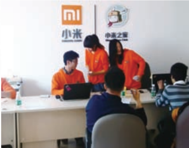
■ 風靡全國的小米手機組建的小米之家售後團隊

北京去年消費增長達到11.6%，最終消費拉動GDP超過58%。從經濟結構來看，自2006年起北京市消費率超過投資率，成為經濟發展的主要動力，消費拉動型經濟業已成型。