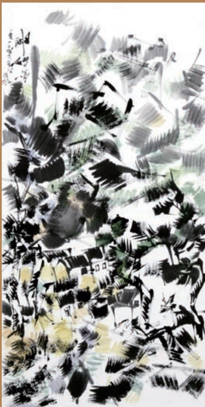
▲ 神仙可得 138cm x 69cm 2012年