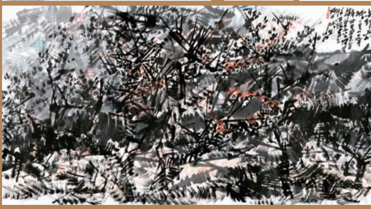
▲ 帝城春 180cm x 79cm 2012年