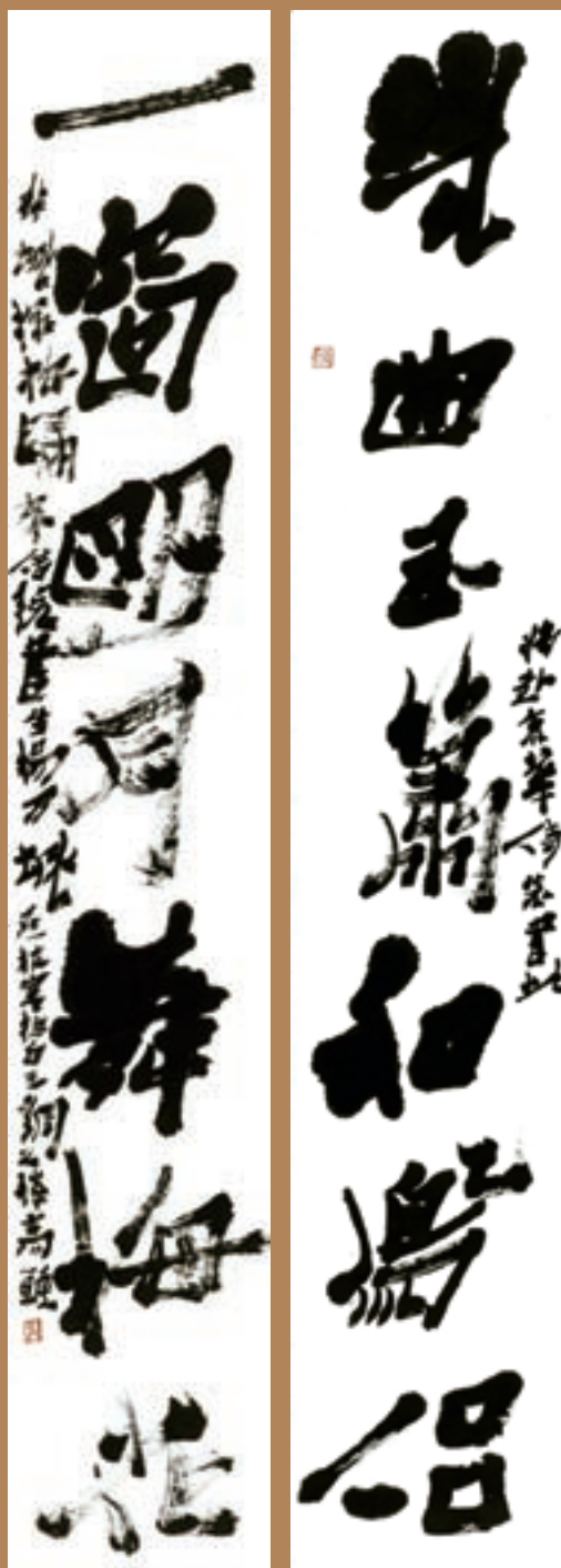
▲ 蘇聯 240cm x 170cm x 2 2012年