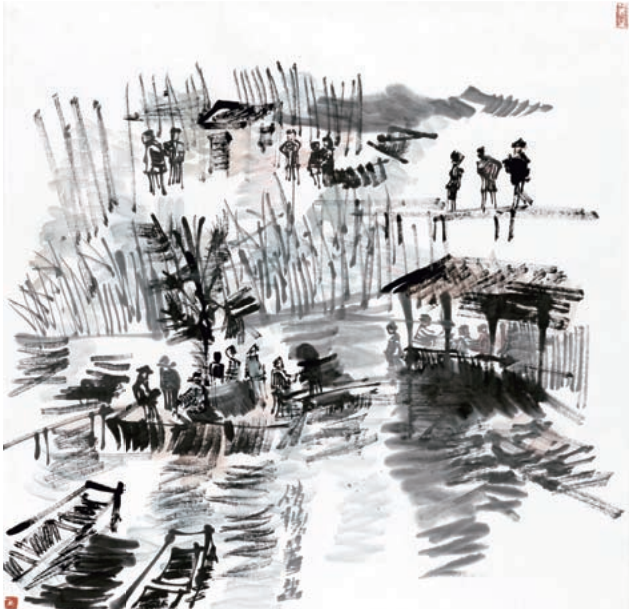
▲ 修禡重開 36cm x 36cm 2010年