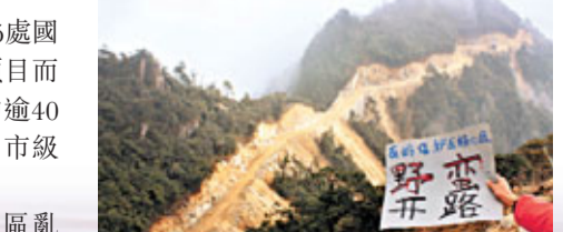
廣東南嶺國家級自然保護區遭野蠻毀林修路。

14.9%國土的自然保護區迄今竟沒有一部法律予以保障。專家強烈呼籲，一部與時俱進、具有更高法律效力的《自然保護區法》亟待出台，以規範政府和企業行為，杜絕不符合保護區功能定位的一切開發利用活動，嚴格禁止將保護區調整為「開發區」。