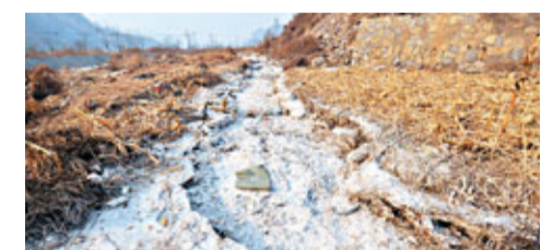
去年年底，山西天脊發生苯胺洩漏事故，圖為涉事化工集團的排污渠乾涸後用石灰粉掩埋。資料圖片

其次，政府要確立城鄉平等觀念，健全農村環境監管機構與監測體系，加快污染防治制度建設，扭轉農村長期「被污染」局面。第三，要統籌城鄉規劃，嚴格履行環保國策與產業政策。最後，要健全協同機制，創建政府主導、部門聯動、公眾參與的環境管控長效機制。