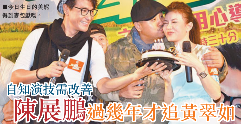
今日生日的美妮得到麥包獻吻。