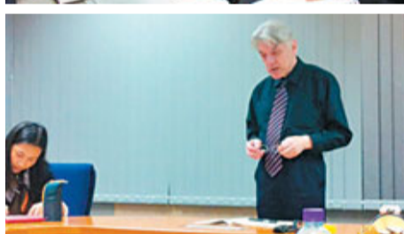
顧彬出席嶺南大學的講座，講述「大陸作家能在香港文學中學到甚麼？」