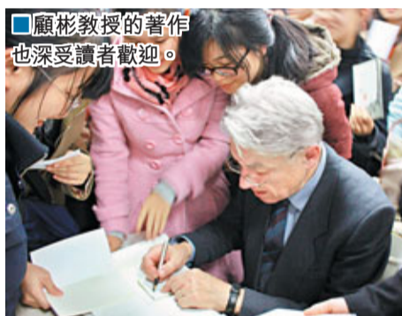
顧彬教授的著作也深受讀者歡迎。

但香港文學在國外並不成功，作家和詩人一直備受忽略。顧彬對此也頗為無奈，「這與香港缺乏政治背景，以及當地政府不太支持文學有關。」但在這位漢學家的心中，始終都為香港文學和藝術保留着一個位置，因為也斯是一個優秀的引路人。