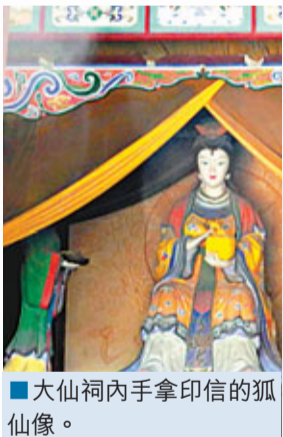
■大仙祠內手拿印信的狐仙像。

為防印信盜失，縣衙亦設有專門供奉守印大仙——狐仙的大仙祠。它的廊柱一律為紅色。狐仙即是狐狸精，性情狡獪，被盜賊偽為上神，既然盜賊都害怕狐仙，那麼由狐仙鎮守印信，必然萬無一失了。古代有「私憑文書官憑印」的格言，地方官員發號施令的憑據就是印信，由此可見印信的重要性。