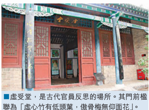
■虛受堂，是古代官員反思的場所。其門前楹聯為「虛心竹有低頭葉，傲骨梅無仰面花」。

古代官員十分重視其在百姓中的口碑，貪了也喜歡落個「廉潔公」的美名。如何獲得這樣的美譽？借助楹聯這種獨特的文化來表白自己，是一個重要的途徑，同時它也表達了民眾對官德的渴求。楹聯是題寫在楹柱上的對聯，亦指對聯，是中國一種獨特的文學藝術形式。葉縣縣衙所有建築前的匾額、楹聯以其精煉