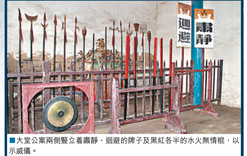
■大堂公案兩側豎立着肅靜、迴避的牌子及黑紅各半的水火無情棍，以示威儀。