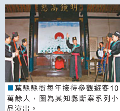
■葉縣縣衙每年接待參觀遊客10萬餘人，圖為其知縣斷案系列小品演出。

六百年的風風雨雨，六百年的滄桑巨變，葉縣縣衙能夠完好的保存下來，不能不說是一個奇跡。也許正是