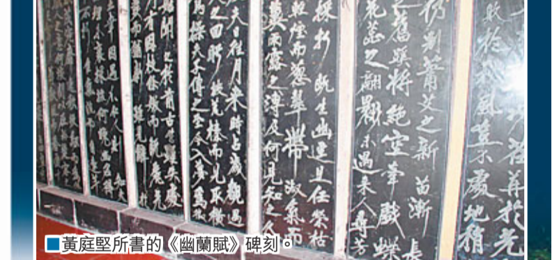
■黃庭堅所書的《幽蘭賦》碑刻。

「五百年滄海桑田」，但在河南葉縣一幢幢林立的現代高樓建築群中，卻有一座600年的明代縣衙絕世而獨立。整個建築群莊嚴古樸、規模宏大、氣勢雄偉，它的一磚一瓦無不訴說着600年來衙署文化的滄桑變化。據專家考證，葉縣明代縣衙，是目前全國現存7座官衙中保存最完整、歷史最悠久的縣衙，2006年更被列為國家一級文物保護單位。無論從它的建築形式、建築藝術、建築功能來看還是其楹聯文化、出土文物價值，葉縣縣衙都是當之無愧的「中國衙署文化活化石」。