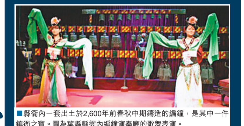
■縣衙內一套出土於2,600年前春秋中期鑄造的編鐘，是其中一件鎮衙之寶。圖為葉縣縣衙內編鐘演奏廳的歌舞表演。

在葉縣縣衙的文物展廳，有一套出土於2,600年前春秋中期鑄造的編鐘。出土後每個鐘都能發出兩個不同音高的樂音。這套編鐘可以演奏古今中外各種樂曲，是目前中國首次發現的春秋時期組合式編鐘，代表了春秋時期音樂的最高成就。除價值連城的編鐘外，還有70多件文物為全國僅存的稀世珍寶，其中包括青銅鼎、《幽蘭賦》碑刻等數十件國家一級文物。《幽蘭賦》碑刻全碑十二通，為宋代四大書法家之一的黃庭堅所書，是最能代表其獨特藝術風格的作品，為我國書法藝術寶庫中的珍品。