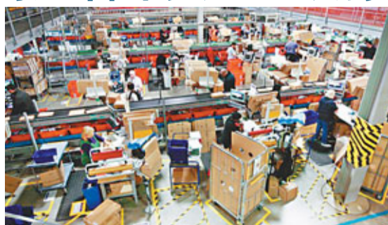
工作指示，經理甚至透過儀器催促員工加快速度，令他們承受極大壓力。

英國經濟低迷，網上零售巨頭亞馬遜投資逾10億英鎊(約118億港元)發展當地業務，刺激就業。然而《每日郵報》揭露，除選程程序嚴格外，亞馬遜物流倉庫(見圖)內工作條件苛刻，強制員工戴上儀器計算步行路程及工作量，恍如「奴隸集中營」！