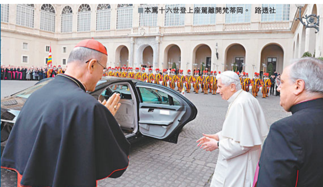
本篤十六世登上座駕離開梵蒂岡。