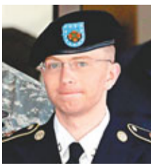
涉嫌向「維基解密」網站披露大量美軍機密文件的美國士兵曼寧(見圖)，前日在軍事法庭答辯時，承認洩露機密文件等10項罪名，面臨最高20年監禁。但他否認協助敵人的嚴重指控。

25歲的曼寧供稱，倘全國民眾接觸到這些資訊，或會熱議軍隊及外交政策的角色。他坦言當向「維基解密」提交機密資料後，他感到完成了對得住良心的事情，並稱資訊應向公眾曝光。曼寧承認非法管有及傳送美軍兩個有關伊拉克和阿富汗資料庫的機密資訊。