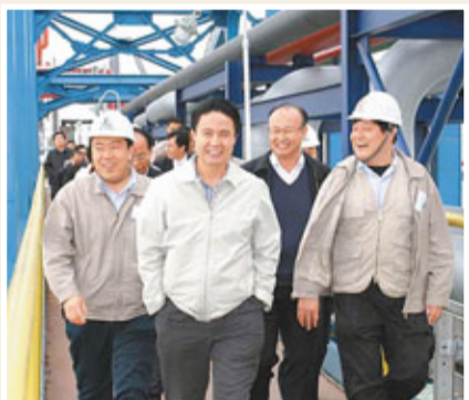
羅保銘(左二)考察洋浦石油專用碼頭。