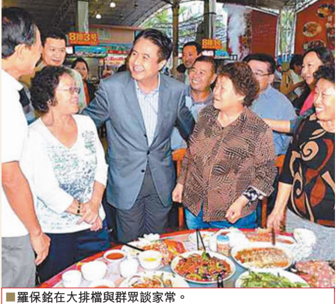
羅保銘在大排檔與群眾談家常。

今年元旦假日，在三亞鳳凰機場等客的「瓊B52442」出租車迎來了以遊客身份體驗三亞「打車難」的海南省委書記羅保銘。司機認出乘客是省書記後有些拘謹，但很快就被羅保銘親切的笑容打消了顧慮，提出了不少富有建設性的意見。