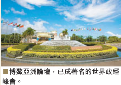
博鰲亞洲論壇，已成著名的世界政經峰會。