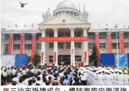
三沙市掛牌成立，標誌海南向海洋強省邁進。