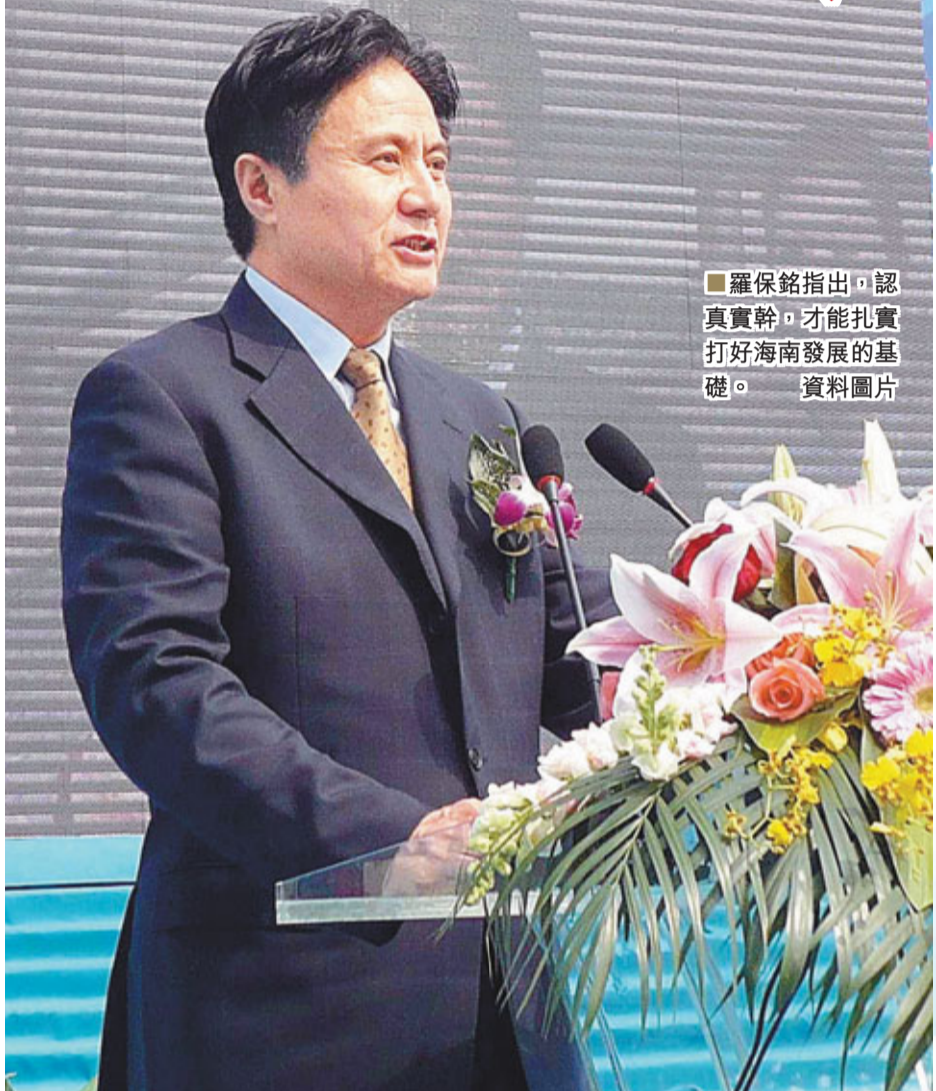
羅保銘指出，認真實幹，才能扎實打好海南發展的基礎。

海南是海洋大省，海南的未來在海洋。2013年海南將大力發展海洋經濟，推進海洋強省建設，力爭年內實現海洋生產總值佔全省GDP的比重達到27%以上。為此，海南將提高海洋開發利用水平，突出抓緊推進三沙市基礎設施建設；編制市縣海洋功能區劃和海域管理、海岸線、海島等海洋資源開發利用規劃；完成三沙區域發展規劃、城市總體建設規劃、永興島與趙述島建設規劃和島際交通專項規劃，全面提升依法管海能力。