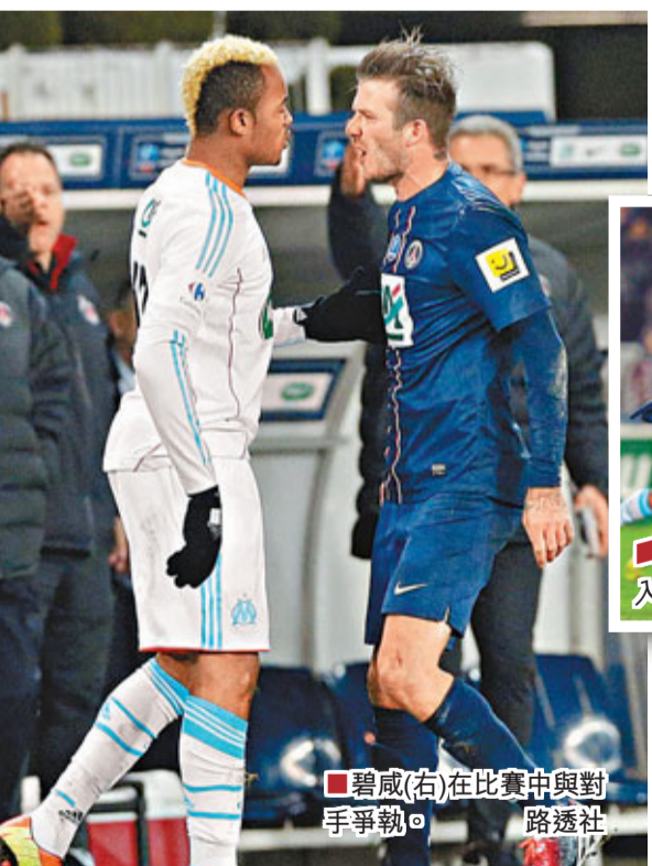
■碧咸(右)在比賽中與對手爭執。

「萬人迷」碧咸於香港時間28日在法國盃首次為巴黎聖日耳門正選披甲，他賽後直言感覺良好；巴黎聖日耳門在法國盃16強，有伊巴謙莫域射連中兩元之下，以2:0擊敗馬賽。