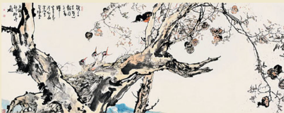
■誰言寸草心，報得三春暉