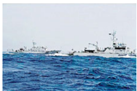
日本媒體公布的中國「海監66」船急速追擊日漁船照片,期間日「水城」號(左)海保巡邏船對中國船隻進行干擾。