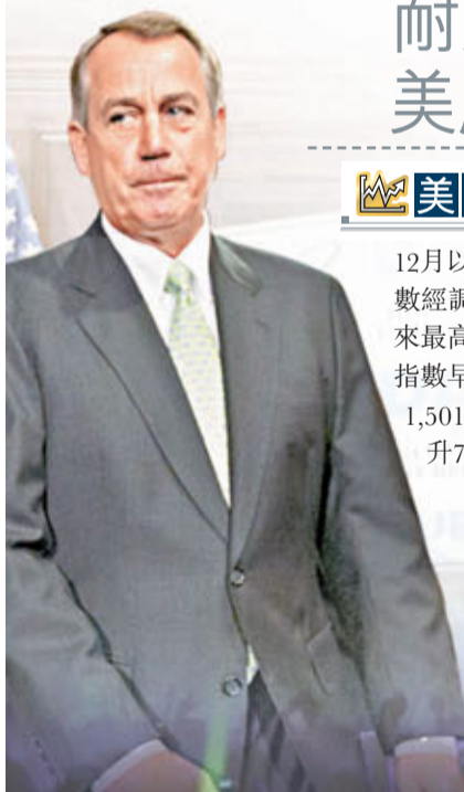
共和黨籍眾議院議長博納批評奧巴馬將軍人作為「人質」。