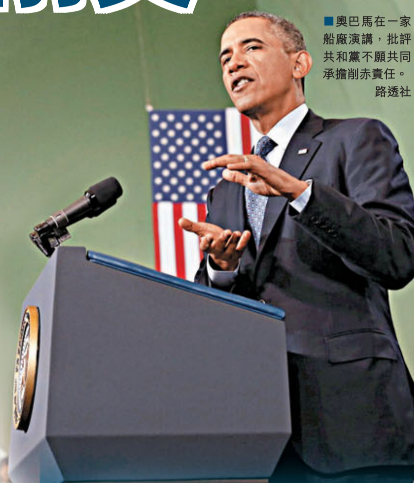
奧巴馬在一家船廠演講，批評共和黨不願共同承擔削減責任。