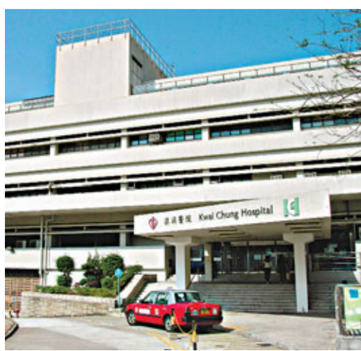
預算案提出在下一個財政年度將動用80億元重建葵涌醫院。網上圖片

在新一個財政年度,醫管局擬將「個案管理計劃」擴展至黃大仙、西貢及北區,令計劃增加服務至本港15個地區,預計將增加2,800名病人受惠,而當局預計2014/2015財政年度更增加油尖旺、大埔及荃灣區(包括北大嶼山地區),屆時計劃可涵蓋全港所有地區,使更多精神病患者得到更佳的照顧。此外,社會福利署也獲撥1,250萬元,為精神健康綜合社區中心增加人手,以配合醫管局推展計劃。