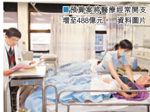
預算案將醫療經常開支增至488億元。

香港文匯報訊(記者 劉雅勤) 公營醫療系統的醫護人手不足,以致病人輪候時間長、服務質素下降。隨著市民對醫療服務的需求與日俱增,港府在財政預算案宣布,於下個財政年度,增加醫療衛生經常開支增加27億元,至488億元,並透過改善和增加各項的公營醫療服務及設施,包括增加醫護人手及增加290張病床,在《醫管局藥物名冊》中增加資助藥物,