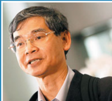
羅致光指出，基金有足夠資金運作，目前並無計劃向商界籌款。

香港文匯報訊(記者 鄭治祖) 新年度財政預算案提出向關愛基金再注資150億元，連同基金原先的50億元政府注資，預計每年投資回報超過10億元。政務司司長、扶貧委員會主席林鄭月娥昨日表示，委員會關愛基金小組，會以該筆額外注資加強對「N無人士」的支援，包括研究於今年下半年再次推出為租住私人樓宇長者，及為居住環境惡劣的低收入人士提供的一次性津貼的計劃，同時放寬申請資格及提高津貼金額，讓劄房住戶也可以受惠，估計數目可能會多達6萬至7萬戶，又會再次為正租住私樓的綜援戶提供一次性補貼，估計會有1.7萬戶受惠。