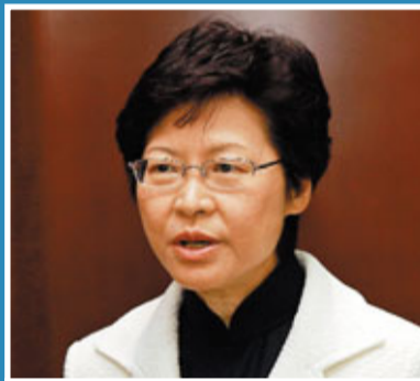
林鄭月娥表示，關愛基金獲再注資150億元後，會援助「N無人士」。