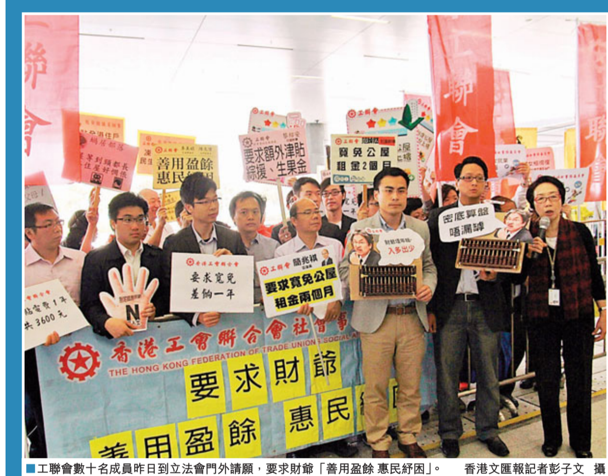
工聯會數十名成員昨日到立法會門外請願，要求財爺「善用盈餘 惠民纾困」。