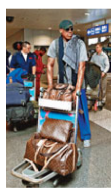
香港文匯報記者蔡明亮

另外,NBA一個由記者及哈林花式籃球隊球員組成的13人代表團昨日抵達平壤,開始對朝鮮進行為期一周的訪問,隨團的還包括前「籃板王」洛文(右圖)。據朝鮮外務省一名官員透露,NBA代表團的訪問將於3月5日結束,期間代表團會參加籃球比賽和為電視台拍攝紀錄片。