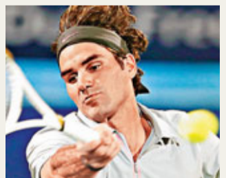
香港文匯報記者蔡明亮

男子方面,世界排名第2位的費達拿(小圖)周一在迪拜公開賽首圈險些陰溝裡翻船,面對名不見經傳的突尼斯球手查斯里,在先失首盤5:7的情況下,連贏2盤6:0和6:2,反勝晉級次圈,賽後費達拿表示自己沒有小觀對手,他說:「大家可能會認為他只是持外卡參賽的球手,所以這是一支上籤。我認為這是有點難處理,因為我完全不知道他的球風等一切。作為衛冕冠軍,首圈賽事往往會構成壓力,我希望有好開局,故對我來說不是一場簡單的比賽。」而澳洲球手湯米奇在昨日的首圈賽事,戰至首盤落後2:3時宣布退賽,親送羅馬尼亞球手漢尼斯古晉級。