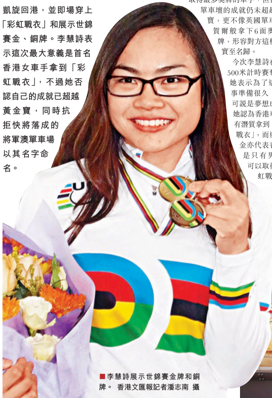
李慧詩展示世錦賽金牌和銅牌。

今次李慧詩在女子500米計時賽奪冠,她表示為了這項賽事準備很久,現在可說是夢想成真,她認為香港車手都有潛質拿到「彩虹戰衣」,而這次摘金亦代表香港不是只有男子才可以取得「彩虹戰衣」。