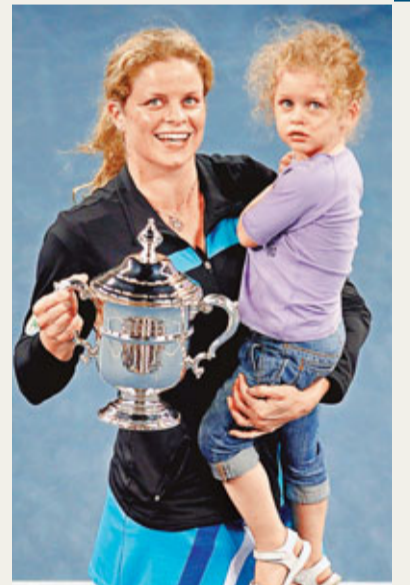
阿金在twitter公布喜訊。資料圖片

去年在美國公開賽結束後決定二度退役的前女網一姐克莉施達絲(阿金),周一在twitter公布喜訊,證實懷有第二胎。阿金在twitter上寫道:「大家好,我們有些興奮消息要告訴大家,Jada要做家姐了。」現年29歲的比利時名將阿金在07年首次掛拍結婚生仔,翌年2月喜誕小千金Jada,直至09年宣布復出,但去年決定在美網結束後二度退役。