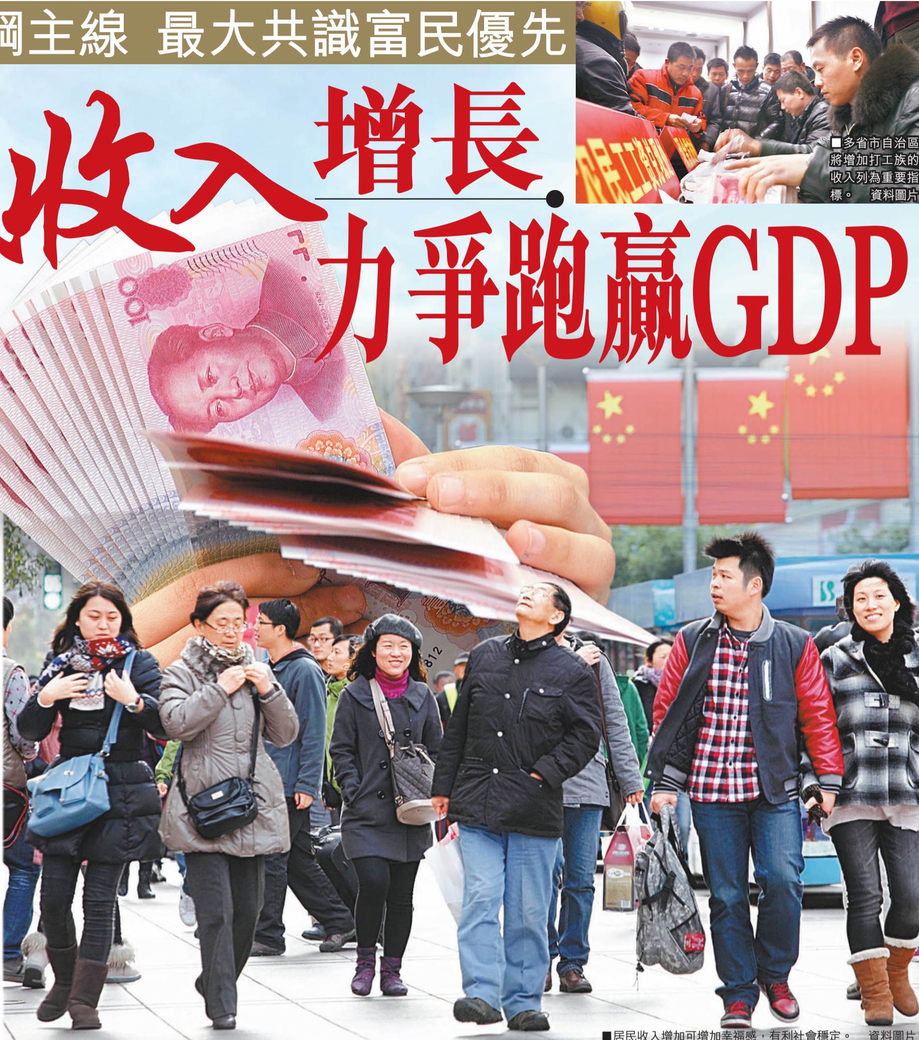
居民收入增加可增加幸福感，有利社會穩定。資料圖片

中國人民大學勞動人事學院教授文躍然表示，收入增長是居民從經濟增長中獲得的最直接收益，有助於提高居民生活水平，增加幸福感，有利於社會穩定。不過，文躍然也指出，各地都提出了收入倍增的目標，但尚有很重要的問題沒有解決，即收入增長的源頭。從目前來看，要實現收入倍增，還需要出台一些具體的措施保駕護航。要實現收入倍增計劃，須進一步拓寬財源，通過增加社會保障、提高民生方面支出方式，為居民收入倍增提供基礎。