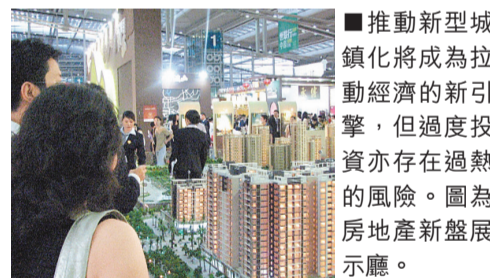
推動新型城鎮化將成為拉動經濟的新引擎，但過度投資亦存在過熱的風險。圖為房地產新盤展示廳。

延續既往規律，換屆後新政府擬定的增長目標總體較高，全國有24個省份的GDP預期增速是兩位數。但與2012年的預期目標相比，全國沒有一個省份的今年GDP預期增速超過去年目標，反而有12個省份調低預期增速。值得一提的是，地方換屆引發投資衝動隱隱再現。