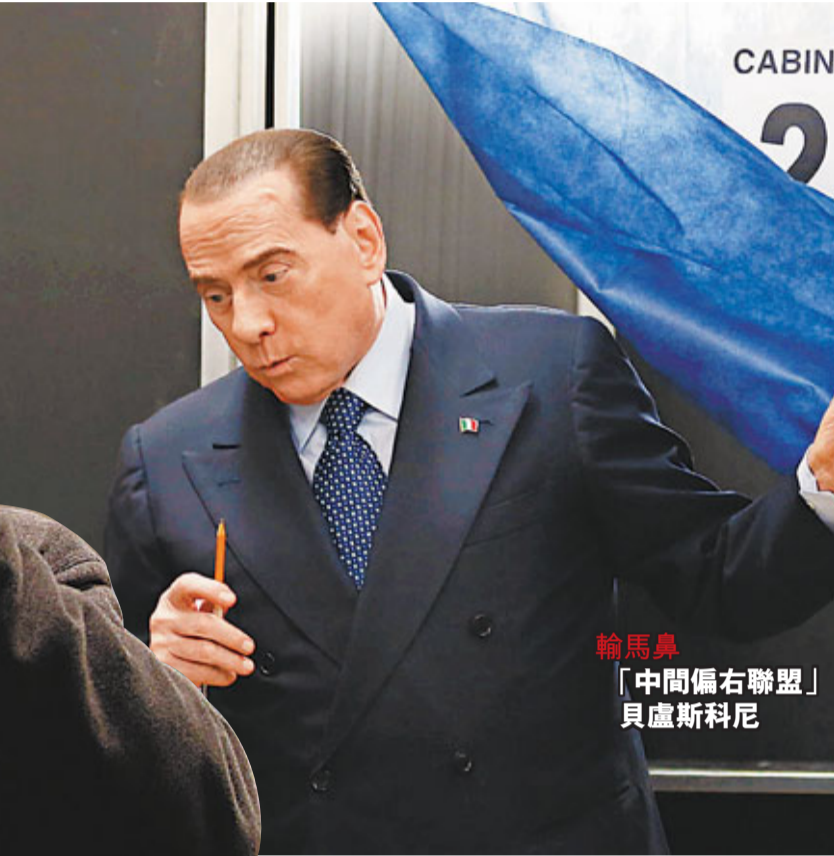
輸馬鼻「中間偏右聯盟」貝盧斯科尼

英國智庫「Demos」成員巴利特認為，社交媒體是格里洛致勝關鍵，其推特twitter關注者數目是英國首相卡梅倫的4倍。巴利特亦表示，歐洲多國民眾對五星支持者的憂慮感同身受，意大利大選結果已為歐洲多個主流政黨響起警號。