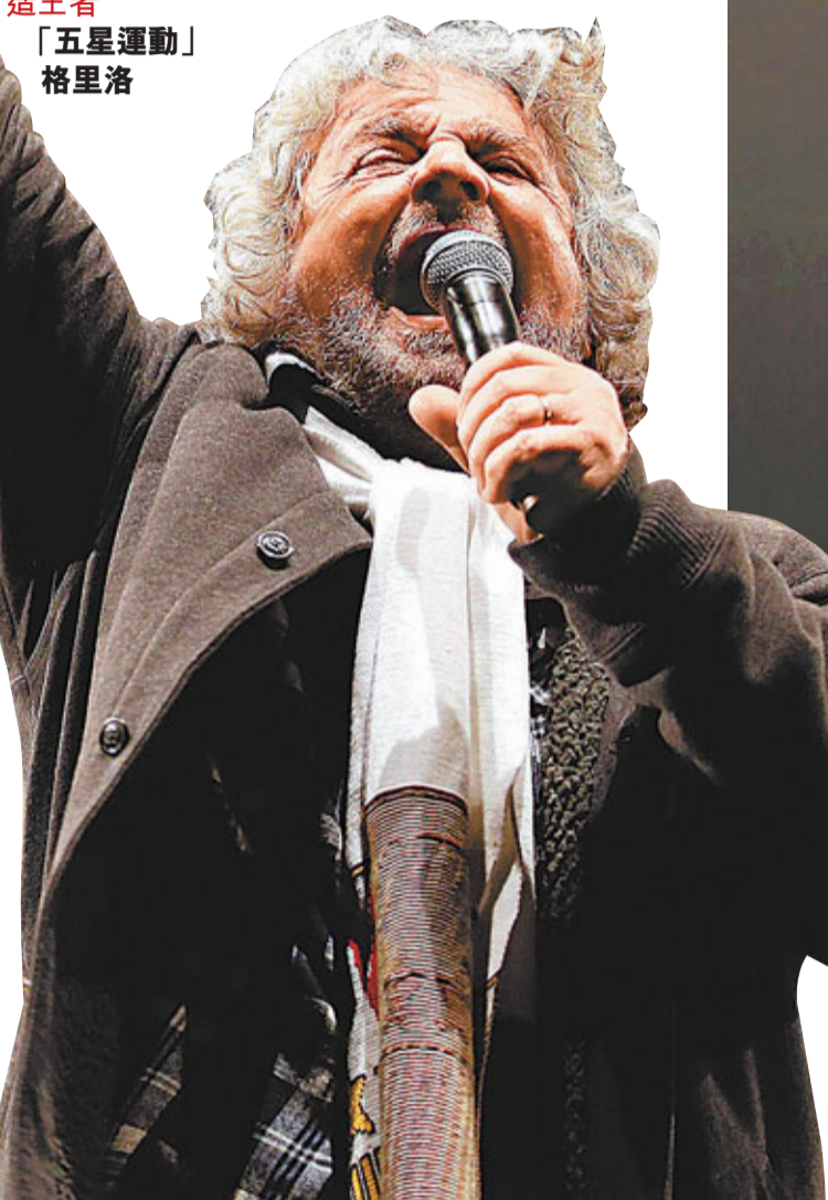
造王者「五星運動」格里洛