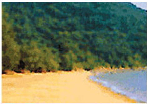
■珠海擬興建一個帆船遊艇基地，即淇澳島帆船遊艇基地。圖為淇澳島。網上圖片

香港文匯報訊(記者 張廣珍 珠海報導)廣東珠海擬興建一個帆船遊艇基地，即淇澳島帆船遊艇基地。該項目總投資約1.39億元(人民幣，下同)，建成後將集遊艇活動、培訓中心、休閒娛樂、餐飲住宿等功能於一體，可容納124艘遊艇停泊。業內人士表示，該基地將進一步促進珠海遊艇產業的發展。