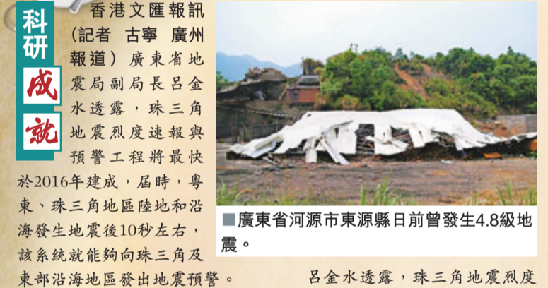
■廣東省河源市東源縣日前曾發生4.8級地震。

香港文匯報訊(記者 古寧 廣州報導)廣東省地震局副局長呂金水透露，珠三角地震烈度速報與預警工程將最快於2016年建成，屆時，粵東、珠三角地區陸地和沿海發生地震後10秒左右，該系統就能夠向珠三角及東部沿海地區發出地震預警。