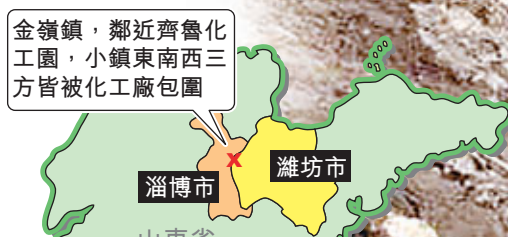
山東淄博市金嶺鎮位置圖

不少村民盼着搬遷，甚至有人視濰坊為理想居住地，「他們那兒也污染，但相比金嶺要好些。」當地村民間談得最多的是死亡，一位頭髮花白的老者說，「感覺最近天天有人出殯」，這幾年，鎮裡得肺癌、胃癌、食道癌的特別多，很