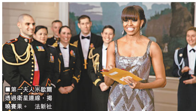
第一夫人米歇爾透過衛星連線，揭曉賽果。