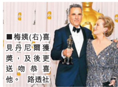
梅姨(右)喜見丹尼爾獲獎，及後更送吻恭賀他。