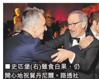
史匹堡(右)雖食白果，仍開心地祝賀丹尼爾。