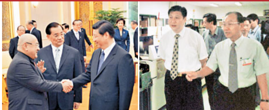
習近平(右)與台灣潤泰集團總裁尹衍樑握手，展現親和與自信。