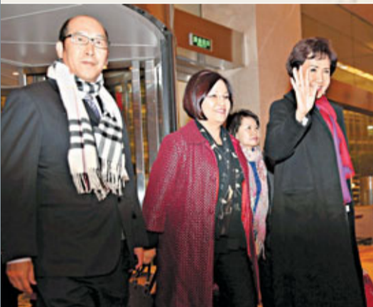
連戰夫人連方瑀(右)等到達下榻的金融街威斯汀酒店。

香港文匯報訊(記者 葛沖 北京報道)「兄弟齊心，其利斷金。」實現中華民族偉大復興，需要兩岸同胞共同努力，我們真誠希望台灣同大陸一道發展，兩岸同胞共同來圓『中國夢』。中共中央總書記習近平昨日在京會見中國國民黨榮譽主席連戰一行，是他履新後首次會見台灣客人。雙方兼顧「繼往」與「開來」。習近平強調，繼續推動兩岸關係和平發展、促進兩岸和平統一，是新一屆中共中央領導集體的重任。連戰表示，兩岸現階段所選擇的道路是正確、有效的，是不會也不應逆轉的；兩岸關係希望能在新的起點上加以深化。