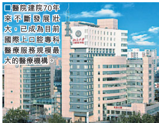
醫院建院70年來不斷發展壯大，已成為目前國際上口腔專科醫療服務規模最大的醫療機構。

2012年，北京大學口腔醫院迎來建院70周年慶典。走過70載，卻走出越來越多的年輕人來：2009年啟動的青年醫師科研基金資助項目有158個；遴選青年醫師進入科研梯隊；繼續舉辦青年醫師學術沙龍並建立主任沙龍；「大學科」共享海外專家經驗；2010年建立院內博士後培養機制；「導師制」啟動，加強科研團隊建設。北京大學口腔醫院的人才發展戰略走上了快車道。