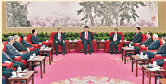
習近平、李克強等早前在中南海同黨外人士歡聚，希望黨外人士知無不言、言無不盡。

都沒有評論，何談什麼尖銳的批評。香港中文大學中共政治專家林和立則認為，習近平此番話並沒有偏離中共一貫表述。