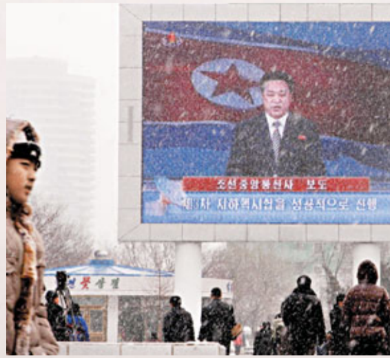
朝鮮不願中國警告進行第3次核試驗，令外界質疑中國對朝政策無效。

出格，反映中國的「柔和」政策無效。此外，中韓關係不斷深化，以及亞洲有可能爆發更大範圍衝突，導致中國新領導層周圍精英人士質問：這個所謂的「緩衝國」有什麼用？