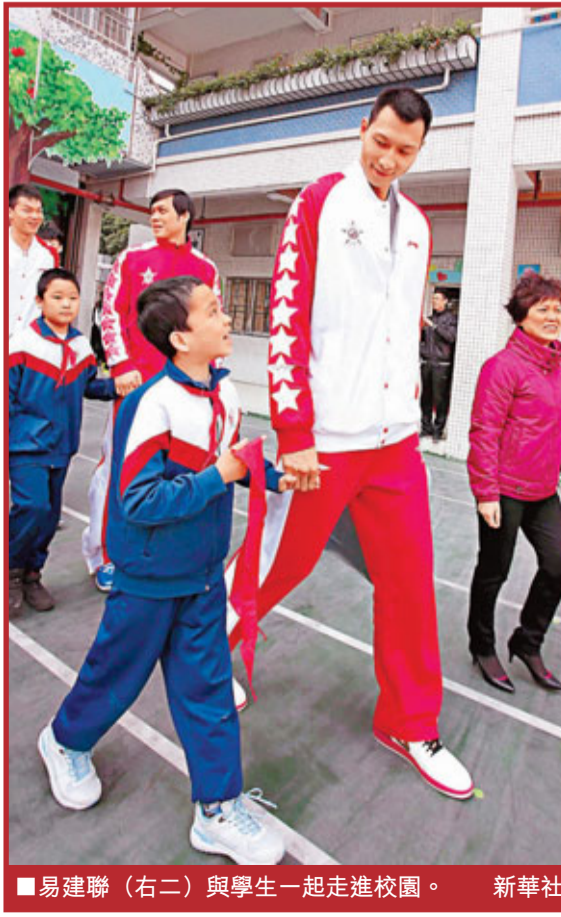
易建聯(右二)與學生一起走進校園。