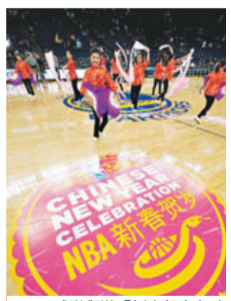
NBA球隊舉辦「新春賀歲」，拓中國市場。資料圖片