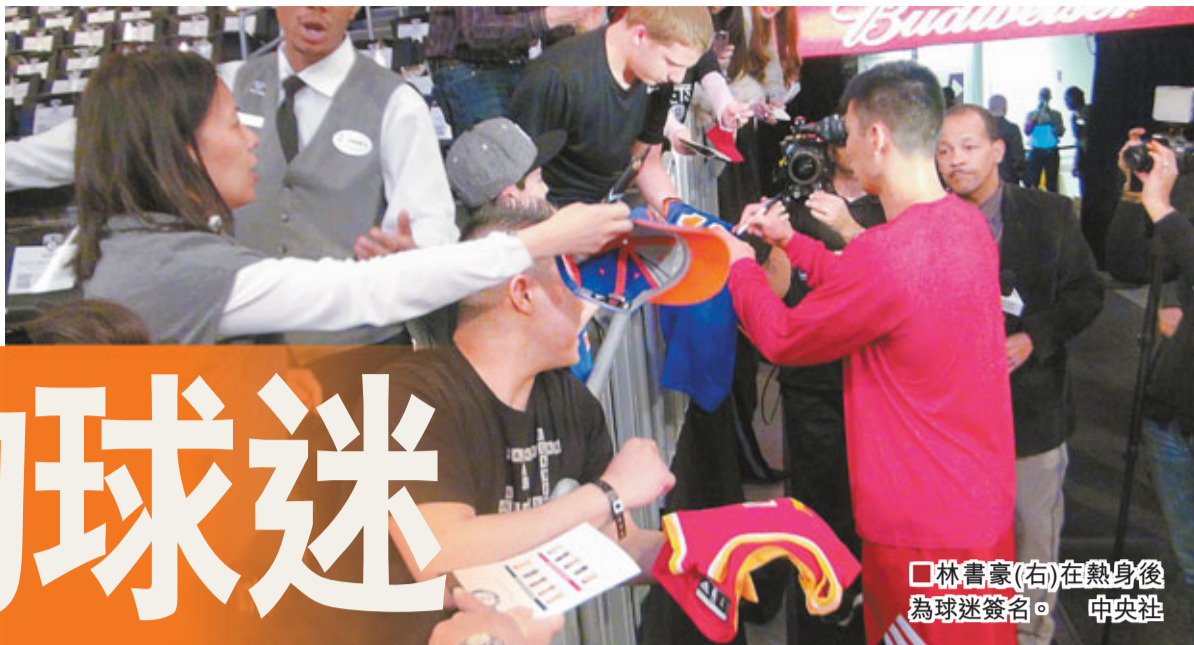
林書豪(右)在熱身後為球迷簽名。