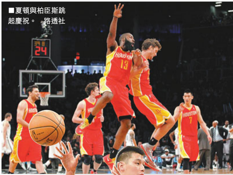
夏頓與柏吉斯跳起慶祝。