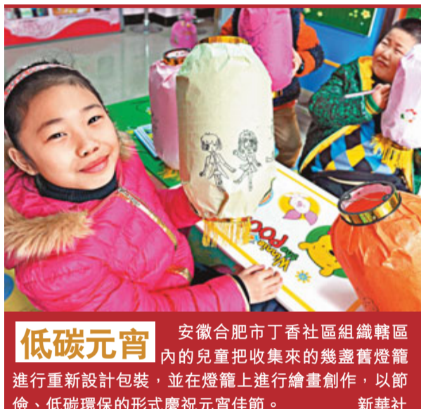
安徽合肥市丁香社區組織轄區內的兒童把收集來的幾盞舊燈籠進行重新設計包裝，並在燈籠上進行繪畫創作，以節儉、低碳環保的形式慶祝元宵佳節。

類白堊紀恐龍腳印化石外，在同一層岩石上，還分佈着蜥腳類、獸腳類和翼龍類等清晰可見的腳印化石，中國罕見。早在2004年，此地曾發現300多個恐龍腳印，卻因開礦被毀。四川理工大學恐龍博物館李奎教授推測，遠在1億多年前，昭覺一帶的岩層還是鬆軟的湖泊泥沙，不同類型的恐龍在此行走後，留下了深深腳印，後被泥沙覆蓋，形成了化石。