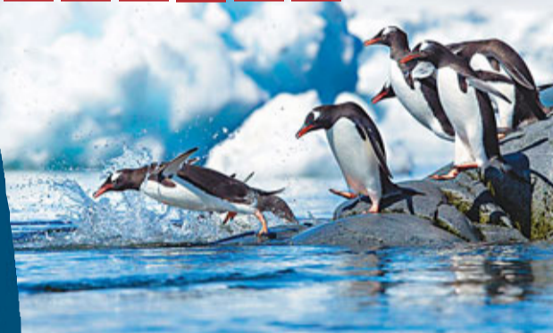
企鵝可愛眾所周知，牠們排排企玩跳水的模樣，更叫人看了歡喜不已。美國攝影師蘇德斯記錄巴布亞企鵝及國王企鵝的日常剪影，只見牠們一隻接一隻伸雙臂跳水，似在進行跳水比賽，形態美妙。