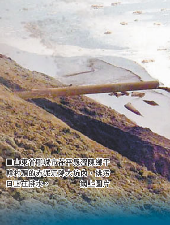
■山東省聊城市在平縣溫鄉干韓村頭的赤泥沉降大坑內，排污口正在排水。網上圖片

香港文匯報訊（記者 房蘇子 在平報道）近日，電解鋁巨頭山東信發鋁業因地下水污染疑雲備受關注。香港文匯報記者經過實地採訪仍發現，信發集團的赤泥沉降大坑足有一個足球場大，裡面盡是絳紅色的廢水。儘管當地環保部門強調堆場大坑裡都設有防滲膜，水可以循環利用，但臨近信發鋁業的在平溫陳街道幾個村莊村民，對於他們的地下水是否遭到污染疑慮重重，因為當地農作物近幾年不增產，用地下水洗衣服衣服會變黃發硬。當地環保部門稱，正在對轄區企業排查，有結果時將向社會公佈。