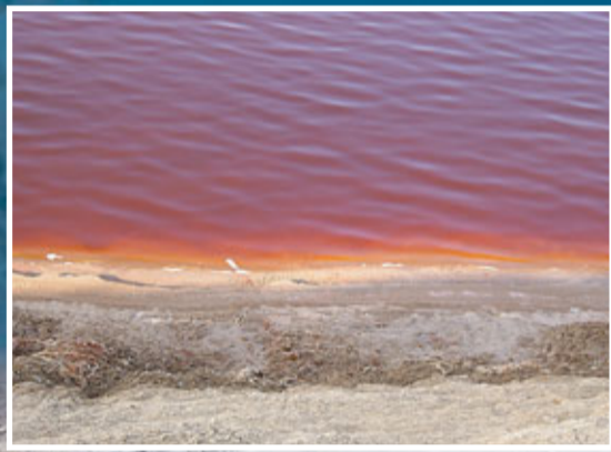
■赤泥沉降大坑是絳紅色的廢水。