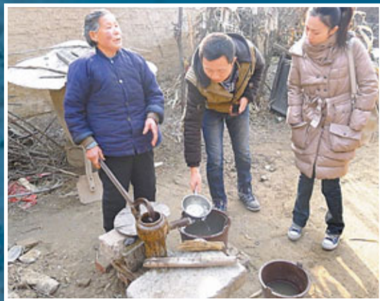
■山東在平縣干韓村，一些老年人還在吃地下水。網上圖片