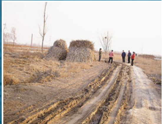
■地下水污染致莊稼減產。本報聊城傳真